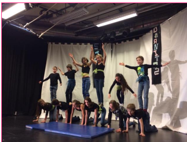
15 forestilling januar 15