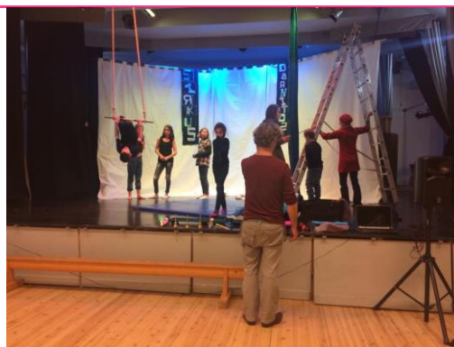
11 Januar 2015