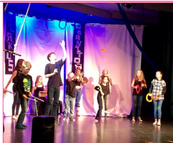
14 forestilling januar 15