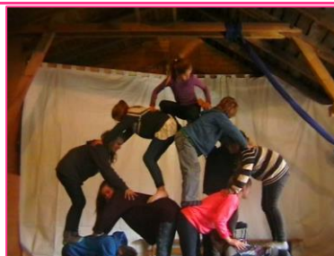
3 workshop mai 2014