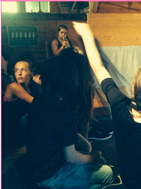
5 forestilling juni 2014