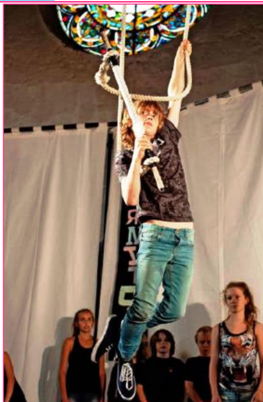
9 forestilling september 2014

http://www.kulturnatt-bergen.no/Dans-Teater.htm