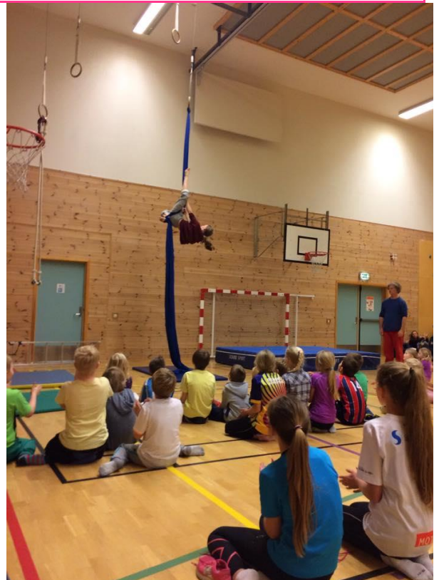
17, 18,19 Workshop Mathopen