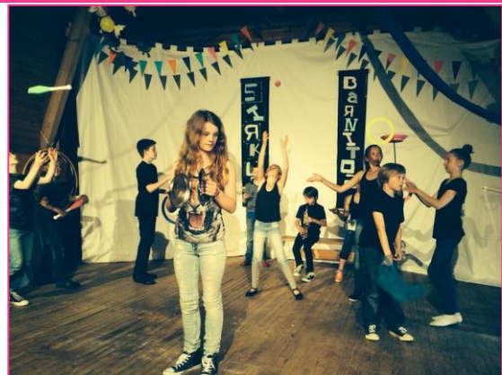
7 Forestilling juni 2014