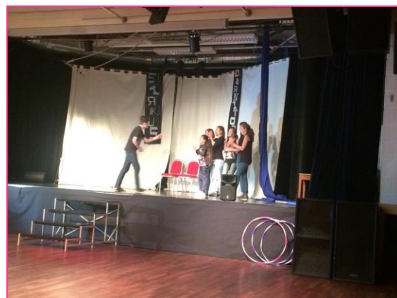
16 forestilling januar 15