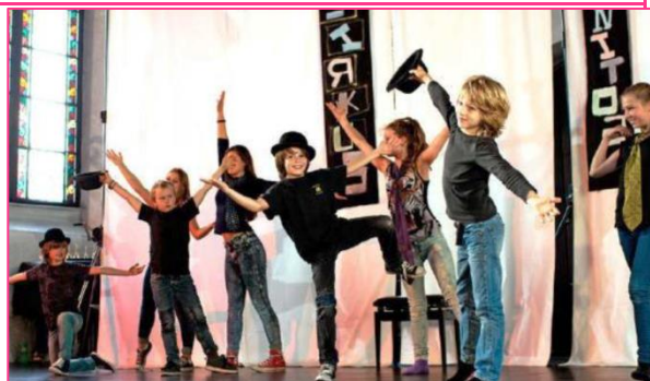
10 forestilling september 2014