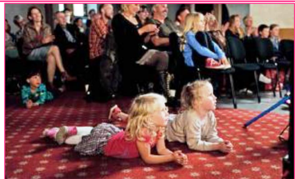
8 forestilling september 2014