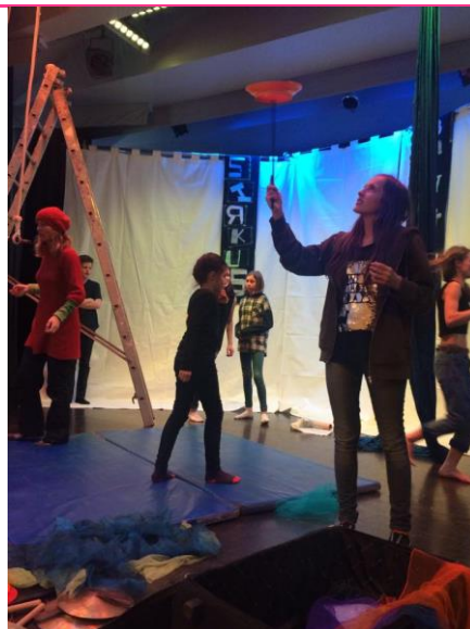
13 forestilling januar 2015