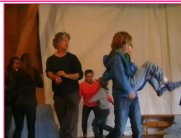
4 workshop mai 2014