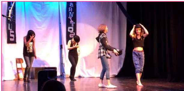
12 forestilling januar 2015