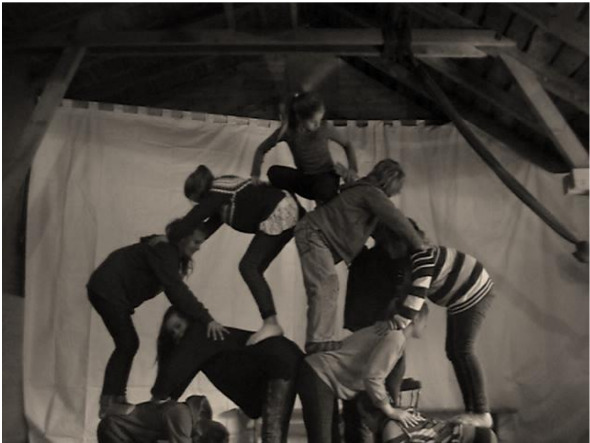
1 Workshop januar 14