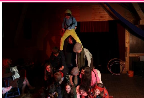
2 workshop januar 2014