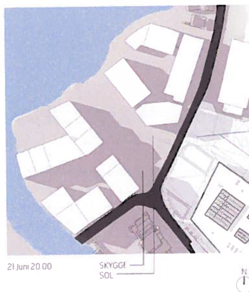
Høyhusforslaget, 21 juni kl 20:00