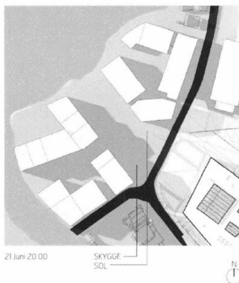
Gjeldende reguleringsplan, 21 juni kl 20:00

Forslagsstiller har hevdet at høyhusets utforming gir mer gunstig solforhold på Byallmenningen enn lavblokker. Det er viktig å presisere at forslagsstillers sammenligning er basert på forslagsstillers eget lavblokkalternativ som fraviker fra gjeldende reguleringsplan i volum og høyde. Gjeldende reguleringsplan gir langt mer gunstig solforhold på Byallmenningen og Kunstallmenningen enn forslagsstillers alternativ 2 med lavblokker.