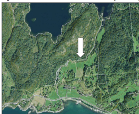
Figur 2 Røyrvik-området markert i biletet.