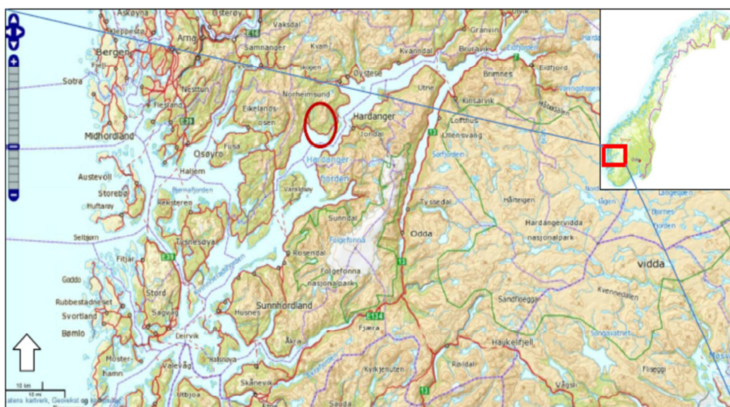
Figur 1 Oversiktskart. Markert sirkel syner utbyggingsområdet.

Utbyggingsområdet Røyrvik ligg på nordsida av Hardangerfjorden i Kvam herad i Hordaland fylke. Det er direkte tilkomst frå riksveg 49 om lag midtvegs mellom Norheimsund og Mundheim. Kraftstasjonen vil få kort tilkomst over innmarka, frå eksisterande avkøyring på offentlig veg.