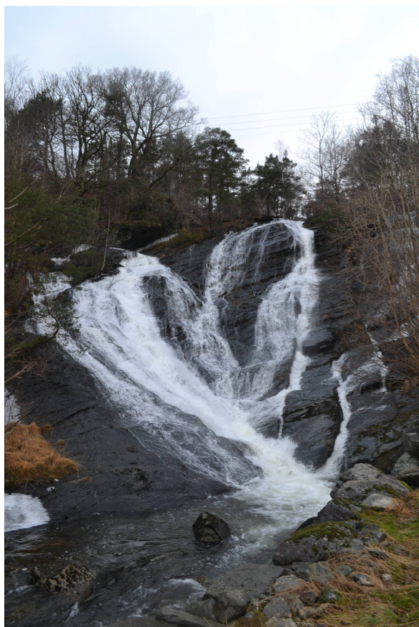
Fig 7 Fossen nedst i Røyrvikelva med middels vassføring under synfaringa 26.01.15

Når det gjeld Røyrvikelva frå utløpet og fossen ned mot fylkesvegen og fjorden, meiner fylkesrådmannen framleis at tiltaket vil få stor negativ konsekvens. Frå tiltakshavar vert det argumentert med at «verdien er allikevel størst ved flom, og ved flom vil vannføringen være så stor at tiltaket i liten grad påvirker opplevelsen».