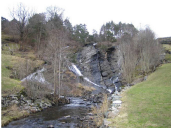
Figur 5 Område for kraftstasjon til høgre. Nedre foss med eiketre til venstre.