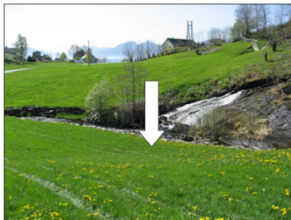
Figur 6 Planlagt stasjonstomt markert med pil.