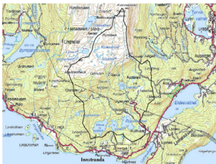
Figur 4 Nedbørfeltet til Røyrvikelva.