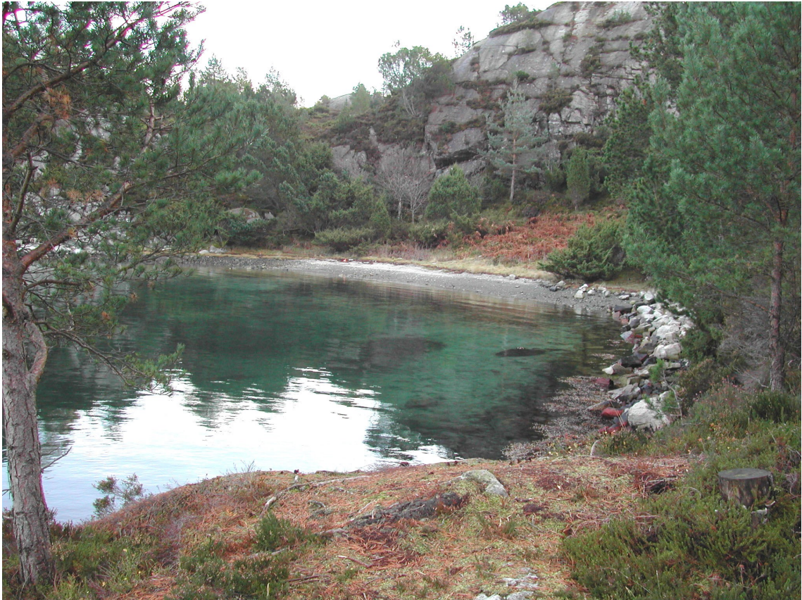
Fra Teløy, badestrand i sør