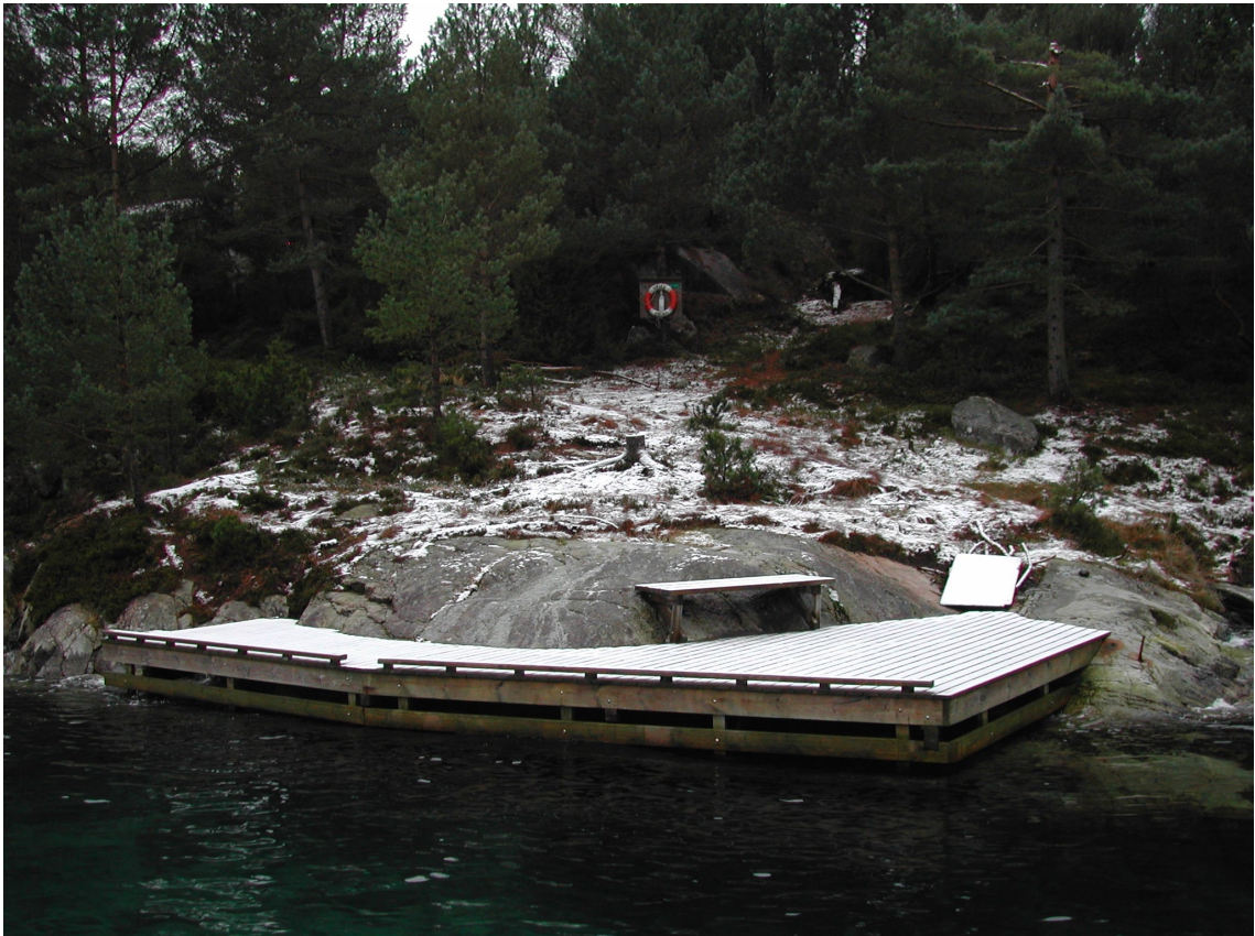
Fra Teløy, ilandstigningsbrygge ved friluftsområdet i sør