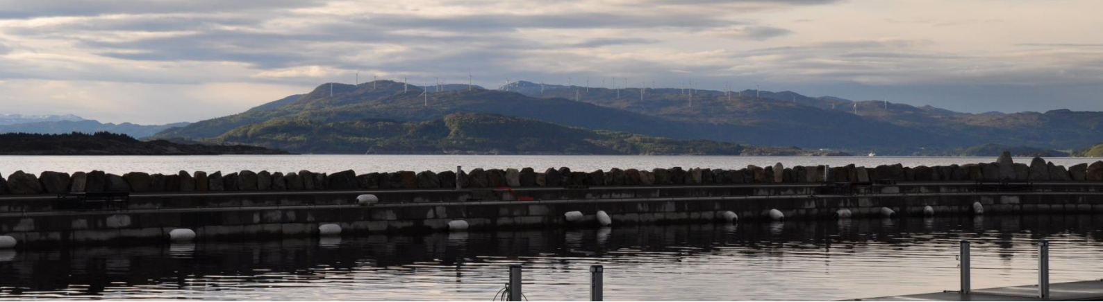
Utsikt frå Bekkjarvik til vindmølleparken på Fitjarfjellet