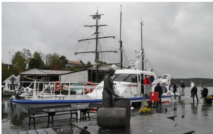
Kommunen inviterte til båttur til området for ny fiskerihavn og til øya Møkster med 60 innbyggjarar