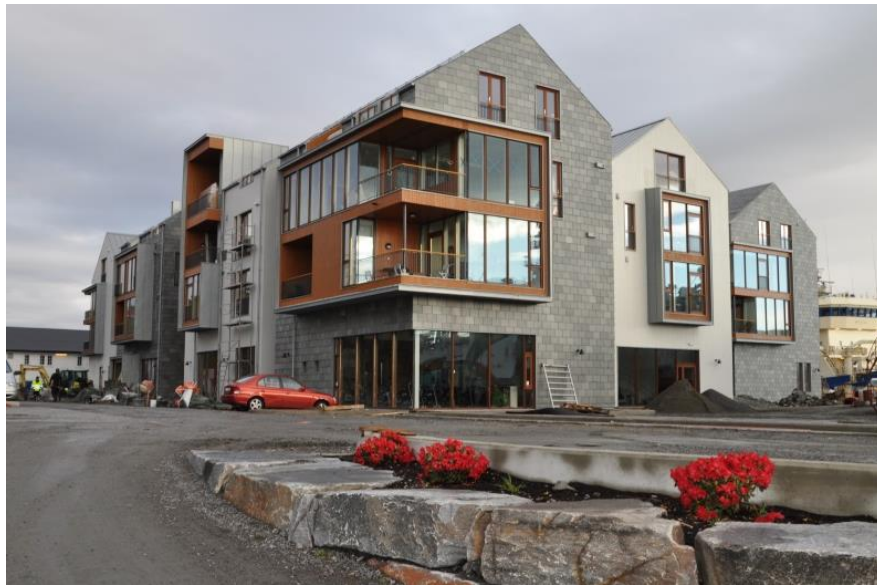
Nye bustader i Bekkjarvik – inkludert 15 kommunale omsorgsbustader