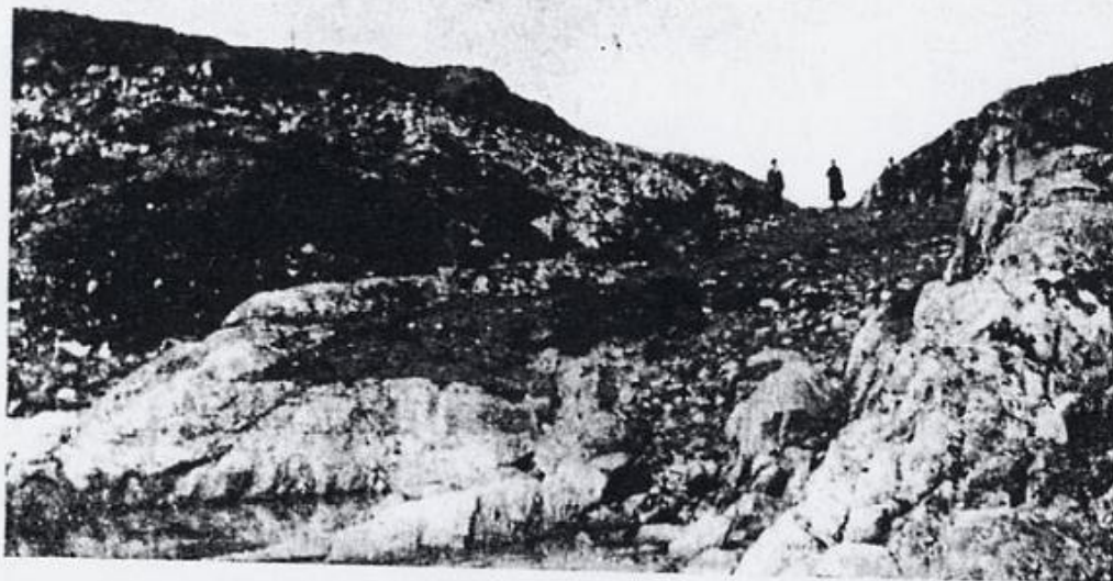
Den gamle Kvalvollen er bratt ned mot sjøen. Folki syner kor langt han gjeng.