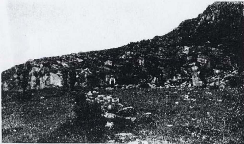
Noko av steinfalet syner.

Denne offerstaden mä verta freda, til minne um gamal tid og tru.