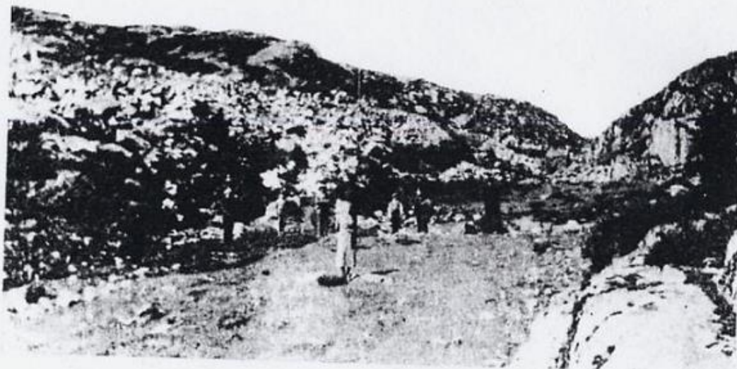
Innpå den gamle Kvalvollen. Offerstaden og steinringen syner i midten.

Den som var godteken til skyttar, hadde sidan lut i skot-tylvti. Og det var karar som kunde skjota. Hans Skoge fortalde um ein som skaut 3 piler etter kvarandre i same tvasen. (Fyrr sa dei tvase um kval, og tvóst um kvalkjøt).