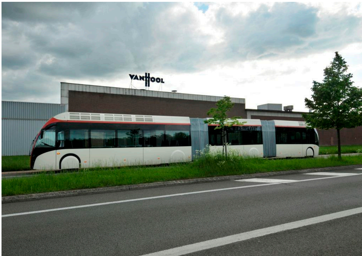
Biletet viser biogasshybridbussen som vert levert hausten 2014 for testing i Bergen.

Prosjektet vil skje i samarbeid med Tide Buss, HOG og Høgskulen i Bergen.