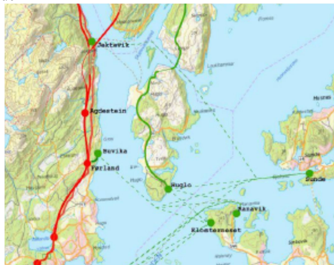
Tabell 8-29 Oversikt alternativer for ferjesamband Stord - Kvinnherad

Som følgje av endra reisetid, vil det også verta ei endring i utviklingsmønsteret for busetting i studieområdet.