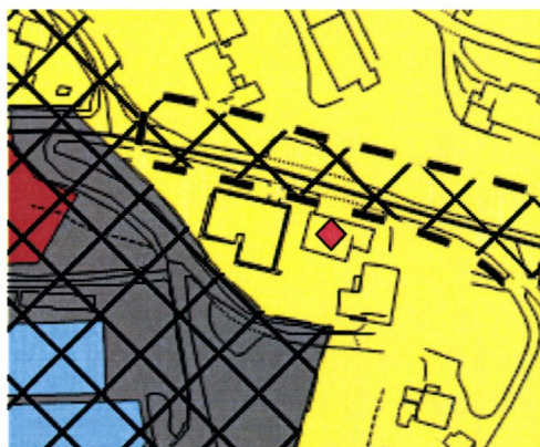
Utsnitt av kommunedelplanen

Eigedomen ligg like utanfor reguleringsplanen for Søbøvik og mellom reguleringsplanen for utvida fylkesveg (vedteken 2005). Reguleringsplanen for fylkesvegen gjer også inngrep i det som er i dag er brukt til parkering. Eigedomen er såleis inneklemt mellom to reguleringsplanar, og ingen av dei har vist løysing med omsyn til avkøyrslar.