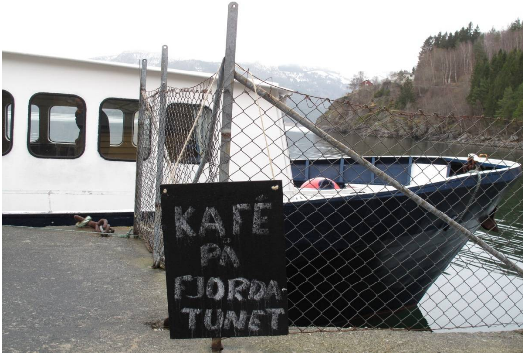
I Kroken samlast lånarane på kafe på Fjordtunet etter bokbåtbesøket