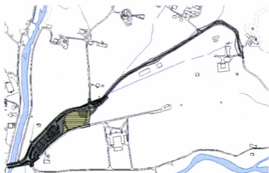
Gjeldande reguleringsplan for omlegging av fv. 53 og parkeringsplass

I samband med at det skulle opparbeidast ny parkeringsplass til Baroniet i Rosendal, skulle fylkesveg 53 gjennom Baroniet mot Hatteberg leggjast om. Det vart utarbeidd reguleringsplan for omlegging av fylkesvegen og parkeringsplass (vedteken i 2007).