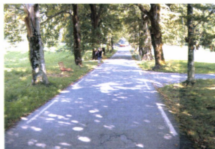
Arm av Fv. 53 (alléen) som skal nedklassifiserast

Postadresse Statens vegvesen Region vest Askedalen 4 6863 Leikanger