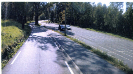
Eksisterande fv. 53 og ny parkeringsplass

Parkeringsplassen er opparbeidd, men ikkje den omlagte fylkesvegen ved parkeringsplassen. Dette p.g.a manglande finansiering. Arm av Fv. 53 (alléen) gjennom Baroniet er fysisk stengd og trafikken til Hatteberg går nå i samsvar med reguleringsplanen.