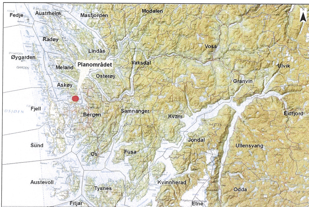
Fig. 1 Kart med planområdet si plassering i Hordaland.

Bakgrunn for saka er oppstart av reguleringsplan for Askøy Senter med planar om utviding av senterområdet, offentleg byggeområde og utbetring av lokalt vegnett. Oppstartmelding vart sendt til Hordaland fylkeskommune 11.03.13, og det vart varsla krav om arkeologisk registrering 03.09.13. Kostnadsoverslag vart sendt 23.09.13 og godkjent av tiltakshavar 04.10.13. Saksnummer 201305127.