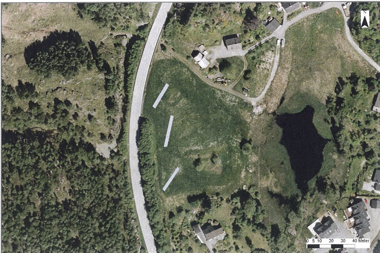
Fig. 4 Flyfoto med sjakter gnr. 9 bnr. 108.

Ved registreringa vart det sjakta med gravemaskin og søkt i overflata etter synlege kulturminne. På gnr. 9 bnr. 108 vart det grave tre sjakter. Området viste seg å være svært omrota, med mykje påfyllte massar. Det vart ikkje gjort funn i sjaktene. Det vart ikkje brukt maskin i andre delar av planområdet på grunn av våte marker/myr og bratt terreng. Resten av planområdet vart overflaterregistrert. Det vart ikkje gjort funn av automatisk freda kulturminne i planområdet. Det vart registrert fleire kulturminne frå nyare tid, det går steingardar langs eigedomsgrensa mellom gnr. 9 og bnr. 9, 10 og 360, i skråninga opp mot Fv 562 på gnr. 9 bnr. 9 ligg det to bakkemurar, og i aust er det ein oppmurt gardsveg som går frå tunet og ut i utmarka.