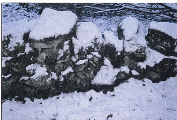
Fig. 6 Detalj av steingard mot S.