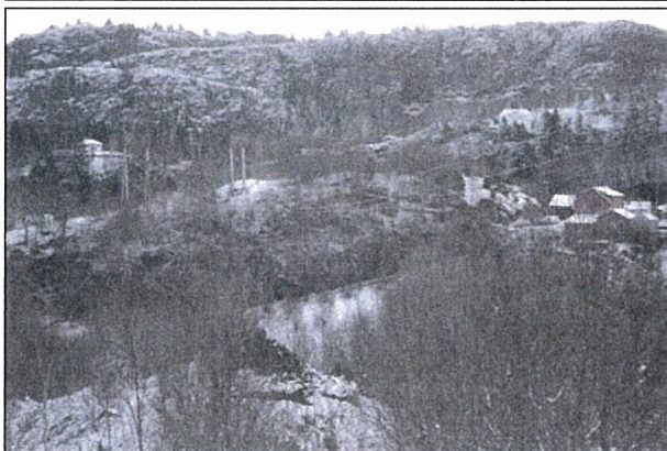
Fig. 7 Gardsveg langs berget mot A.