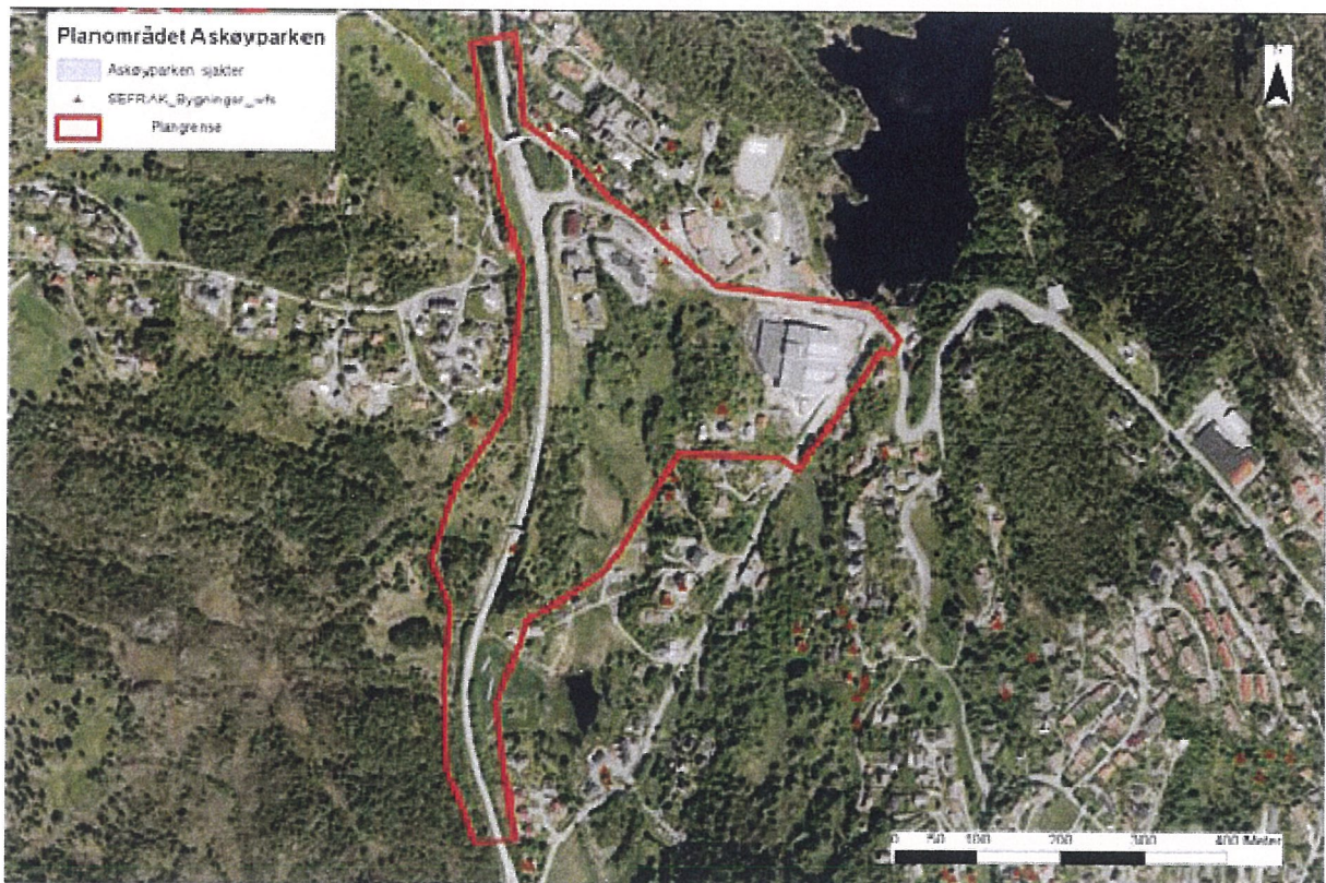
Fig. 2 Flyfoto med plangrense, sjakter og sefrakregistrerte bygningar

I planområdet er terrenget kupert med fleire store bergkollar. I midten av planområdet sørvest for Askøy Senter ligg det nokre større flater med svært fuktig beitemark. Terrenget skråar bratt oppover mot Fv 562 i vest. Vegetasjonen er gras og myr med tynn lauvskog på kollane og i skråningane. I nordleg del av planområdet er det ein del utbygd areal, mellom anna Askøy Senter, Kleppe barnehage og private bustader.