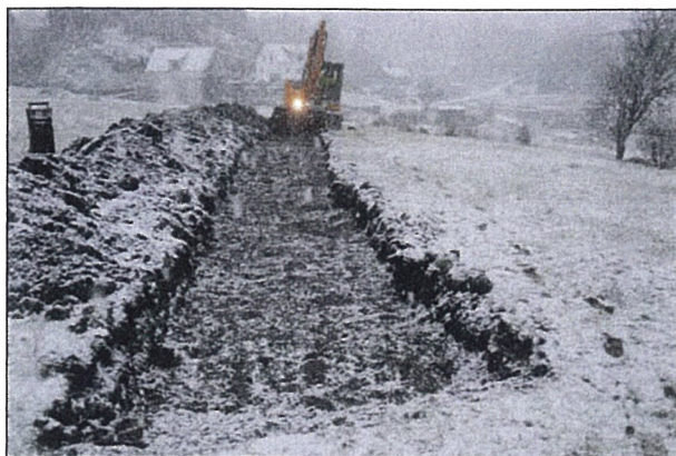
Fig. 5 Sjakt 1 mot NNA.