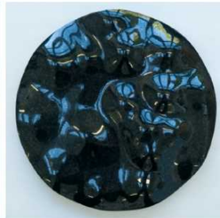
Nr. 6 Europa, diabas