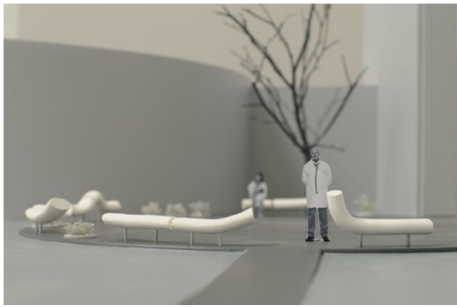
Sitteskulpturer utformer og avgrensner et uteområde i forbindelse med sykehusets cafe.