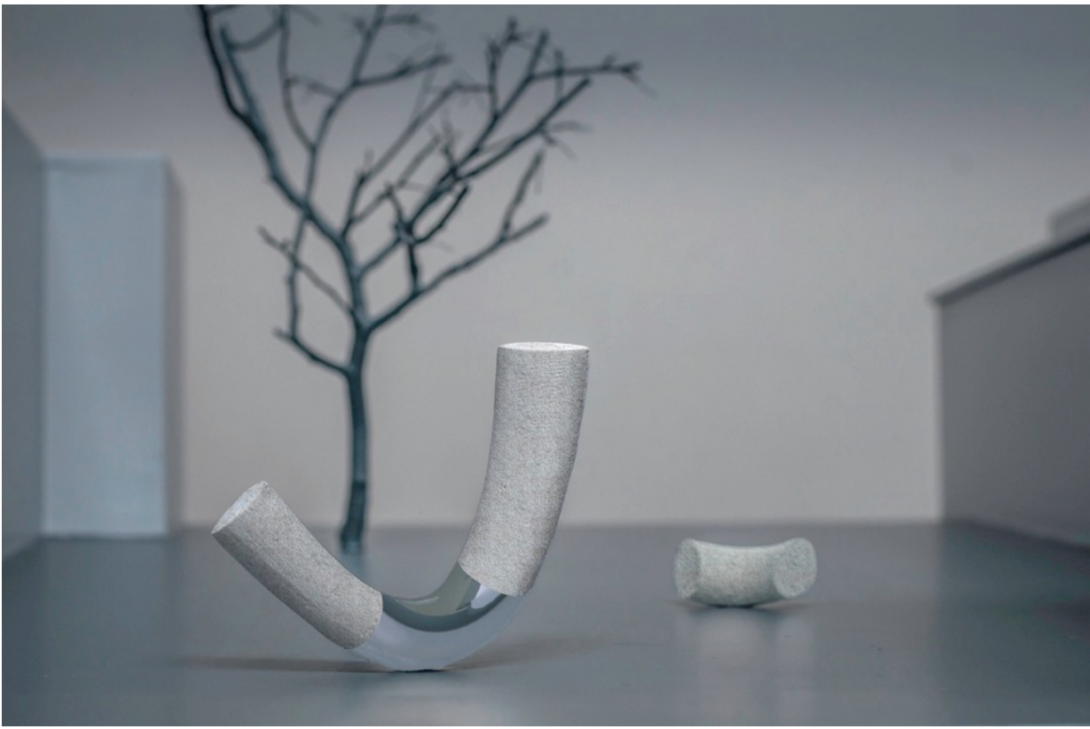
Skulptur til indre gård i sykehuset.

1. pris til to skulpturistallasjoner til Mölndal sjukhus, ny ortopedisk forskningsavdeling, ved Göteborg. Skulpturene skal utføres i ulike yper av granitt og rustfritt stål. Skulpturene skal lyssettes og ferdigstilles våren 2017.