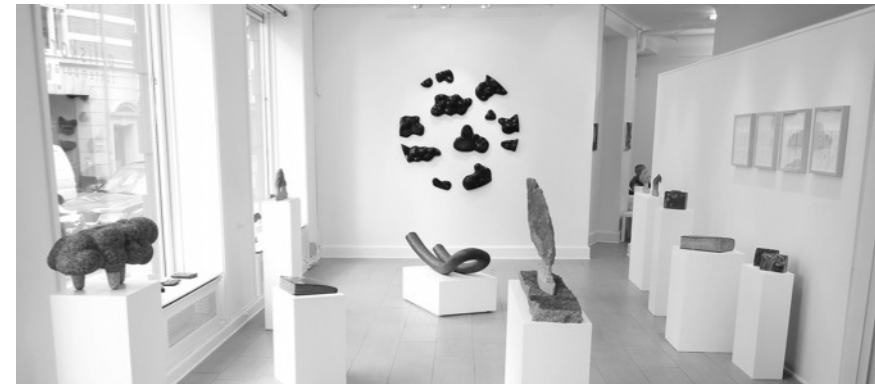
Black story på Priiskorn Contemporary i København høsten 2014