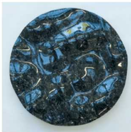
Nr. 4 Thebe, diabas

Til nå har jeg utført de seks første månene Metis, Adrastea, Amalthea, Thebe, Io og Europa.