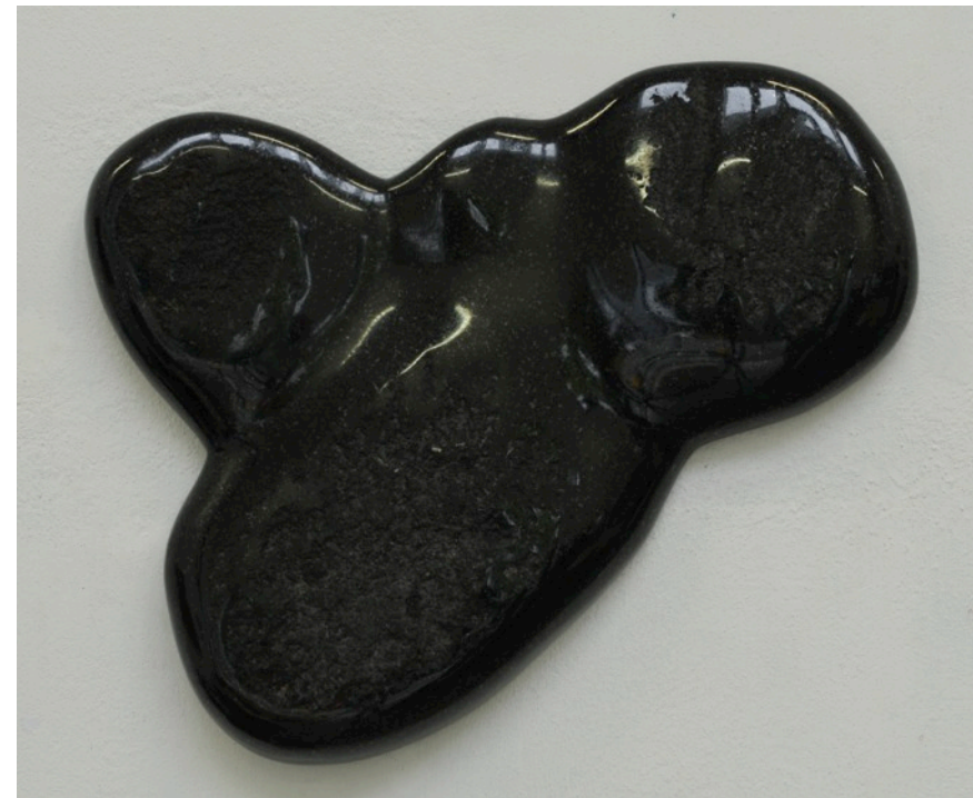
Detaljebilde, krysshamring og polering