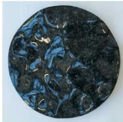
Nr. 5 Io, labrador