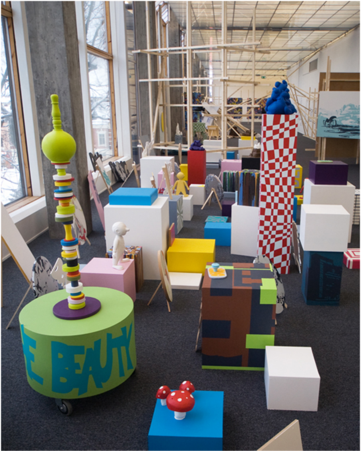
Christianssand Kunstforening 2010