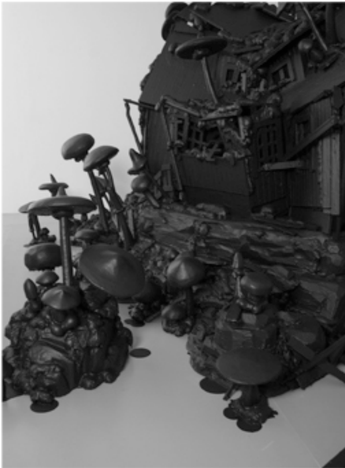
From our house to bauhaus Galleri Boa Oslo 2013