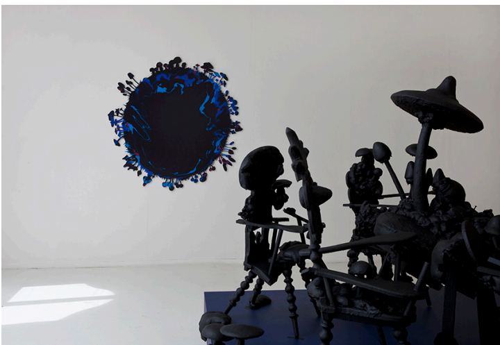
ØKS Fredrikstad 2014