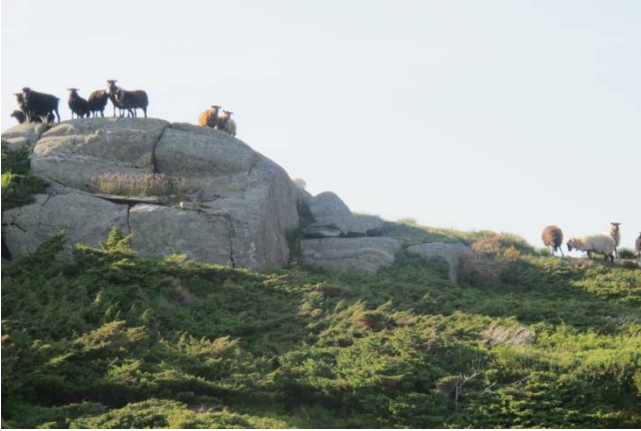
Sauene våre på beite