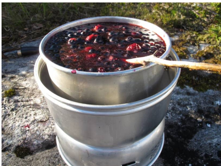
Inn På Tunet aktivitet på Litle Sleire 9.2