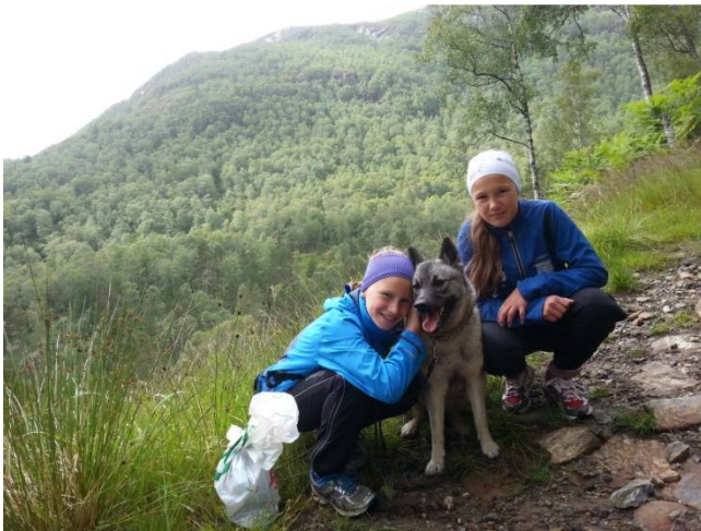
På veg til Myrdalen – linja vil komme like bak jentene