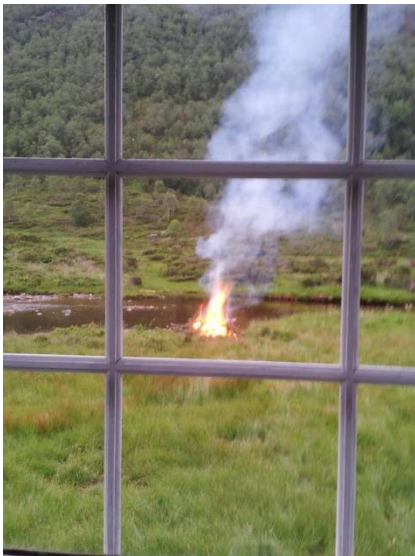
Utsikt frå glaset på setra Kjellsbu, Myrdalen ( Litle Sleire 9.2)

Denne utsikten vert særst annleis og stygg om kraftlinja kjem – då kjem ho rett øve elva her!