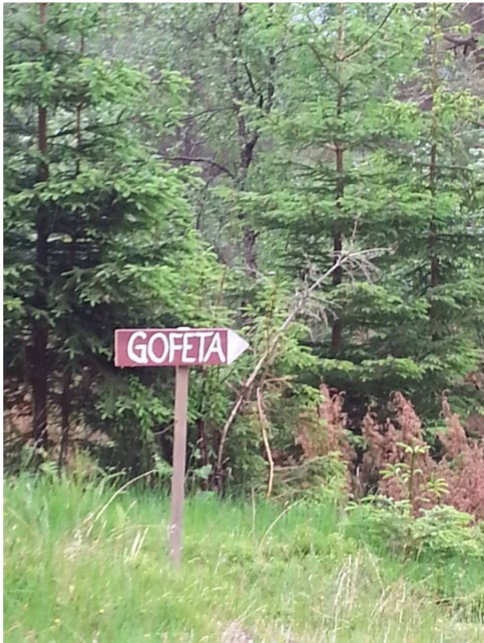
skilt ved skogsvegen til Godfeta-der linja vil gå