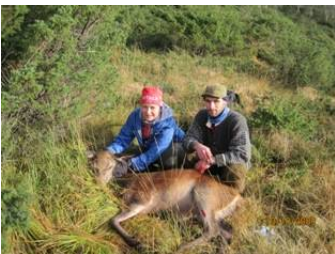
Jakt ved Andershaugane