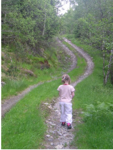
Lita jente på tur innover skogsvegen til Myrdalen