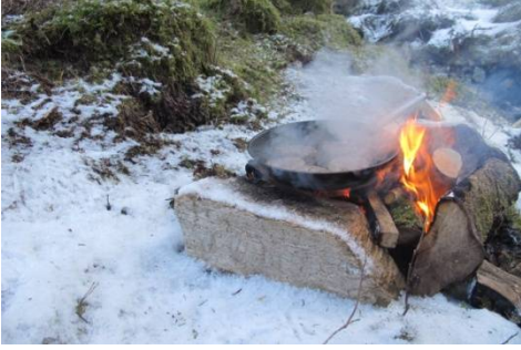
Inn På TUNET aktivitet