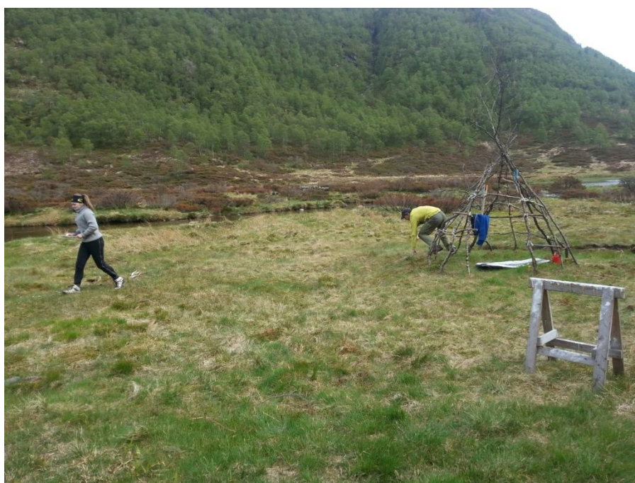
Stafettmoro på Myrdalen