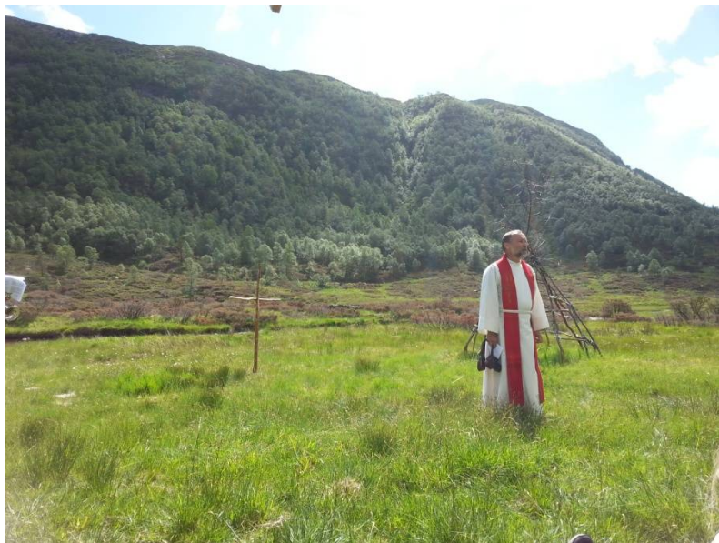
Stølsmesse på Myrdalen

Ei linje vil komme til syne rett bak presten