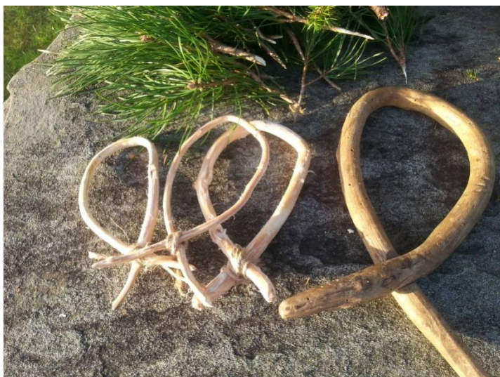
Inn På Tunet aktivitet