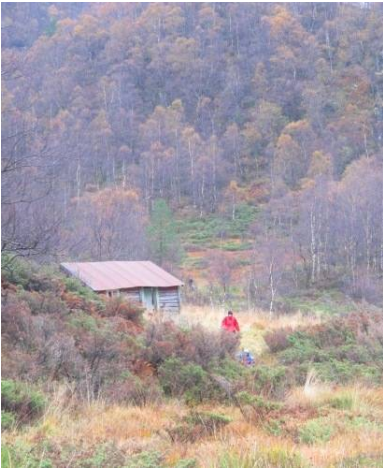
Tur på Myrdalen