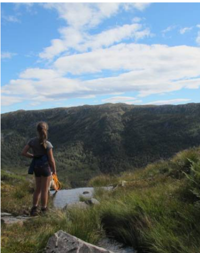
På tur for å sjå etter sauene- utsikt ned i Myrdalen mot Halsane