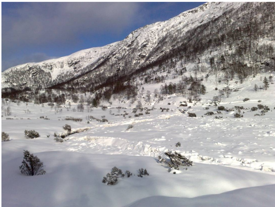
Myrdalen mot Grindebotn – vinter