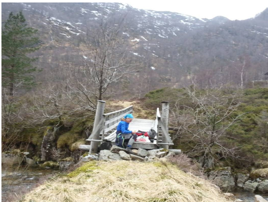
Turlagsaktivitet og trimpost ved brua på Myrdalen