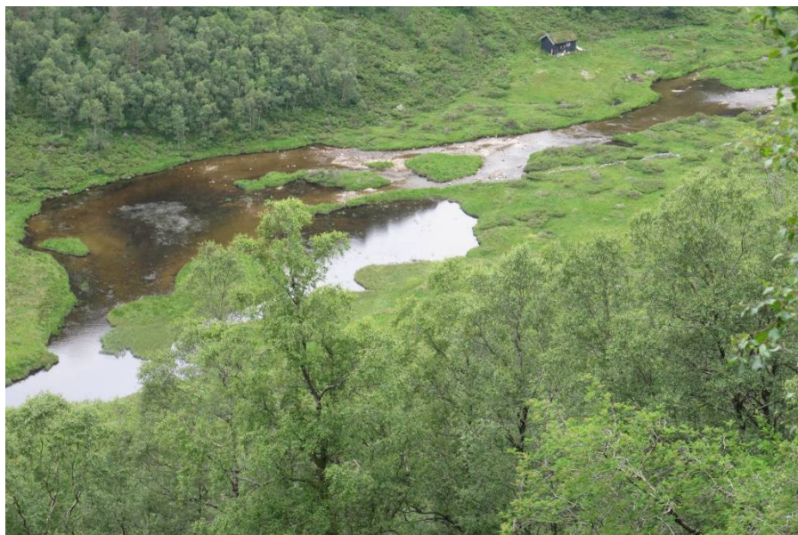
Setra Kjellsbu Myrdalen

Bilete frå området Myrdalen og nedover langs omsøkte linje