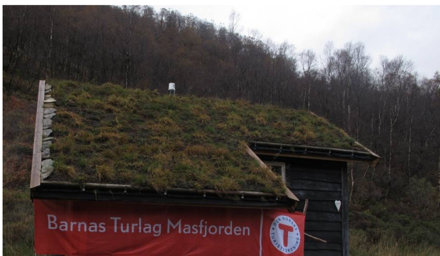
lån av setra til Barnas Turlag