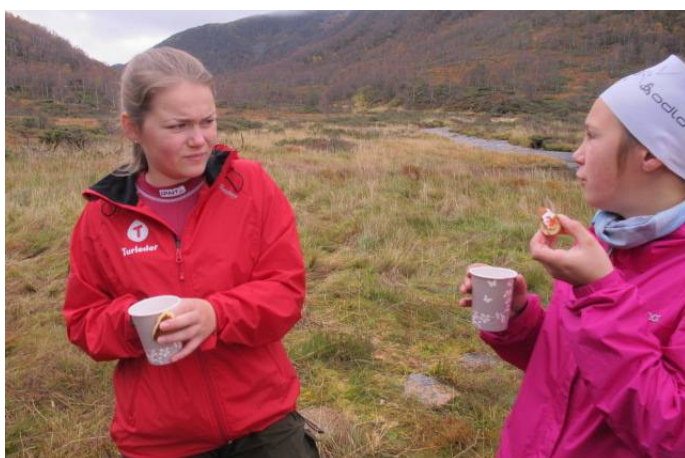
Kos på Setra