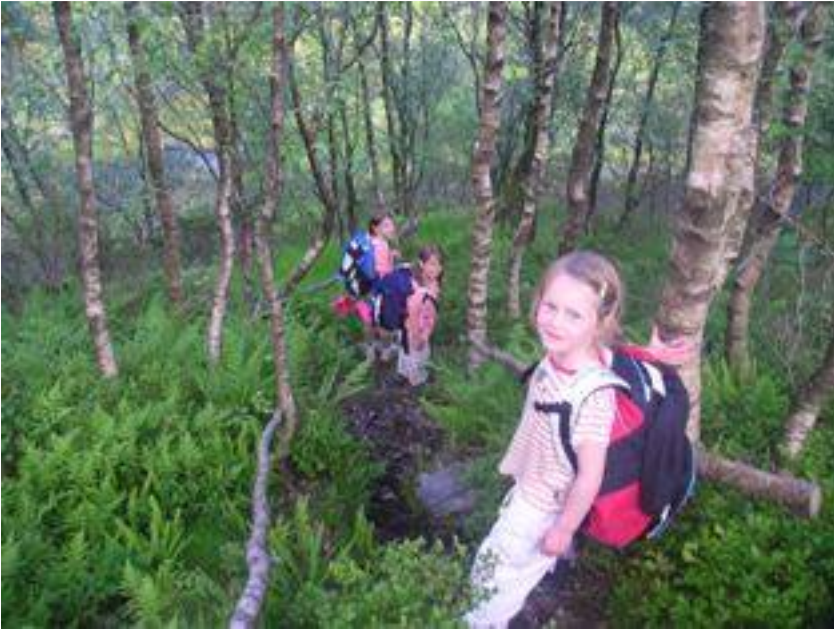
På veg ned til setra frå skogsvegen