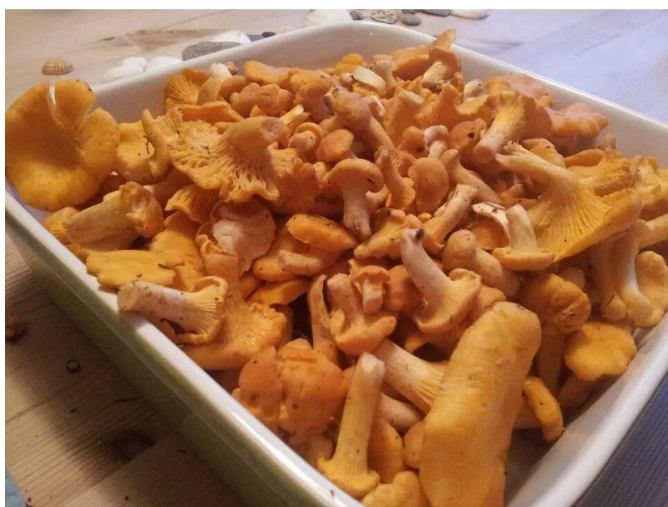
Hausting frå ein hemmeleg stad på dalen!