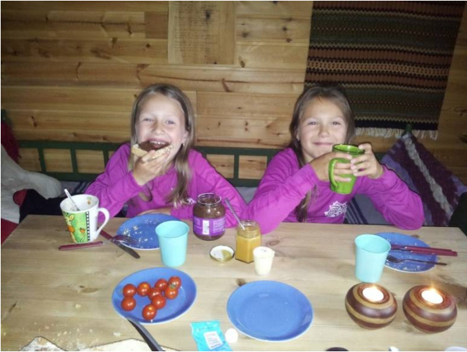
kos på setra Kjellsbu, Myrdalen