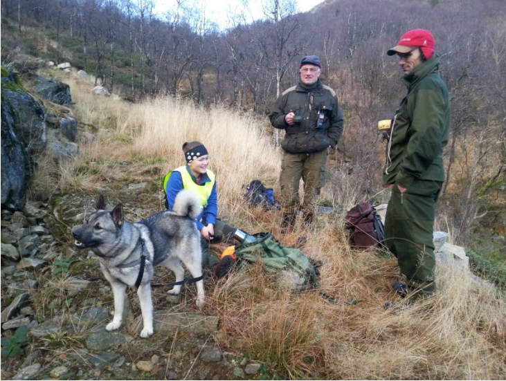
Jakt – 3 generasjoner skogsveg v. Godfeta