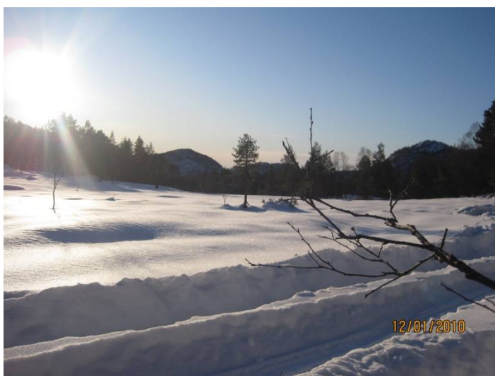
Traktorspor – vinter gjev moglegheit for skogsdrift