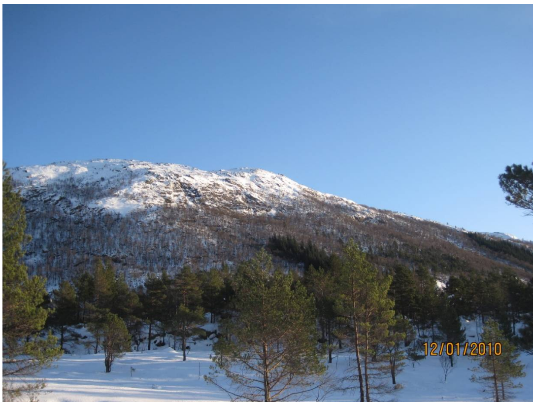
Bilete mot Sleirsfjellet frå Lahaugane – ei ny kraftlinje vil gå like bak fotografen!