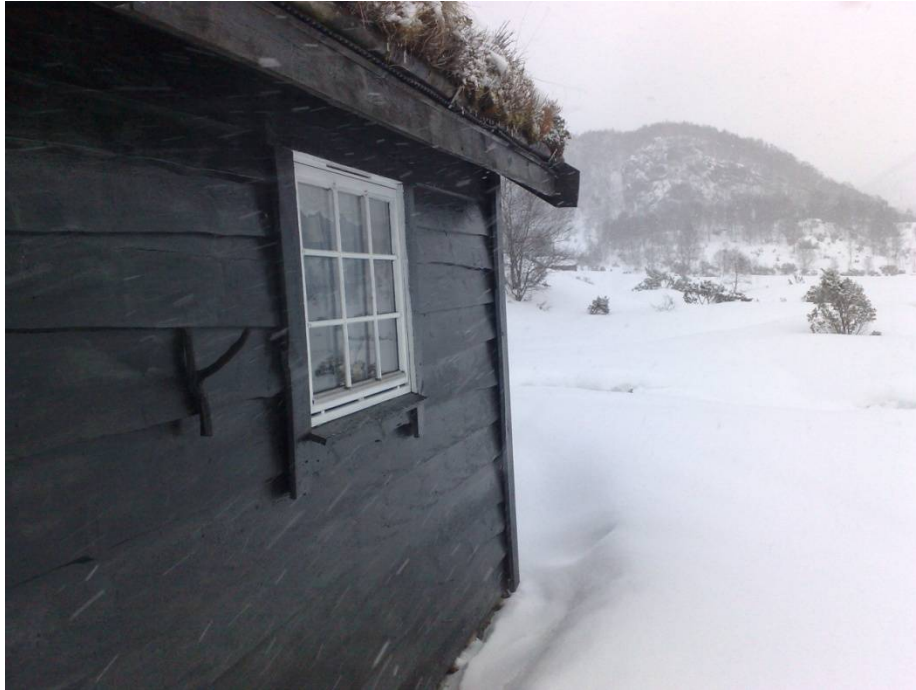
Setra Kjellsbu vinterstid