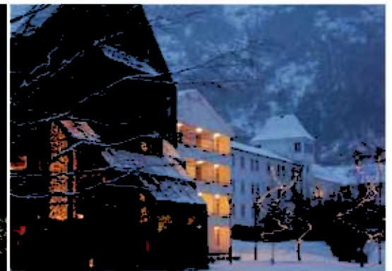
Tradisjonelt julebord m/dans