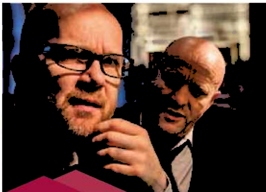
Skilte menn rir igjen