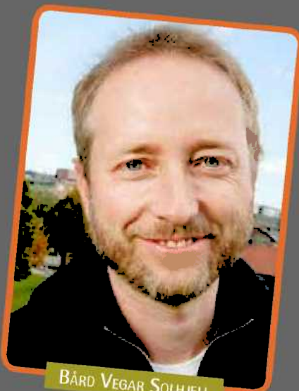
BÅRD VEGAR SOLHJELL