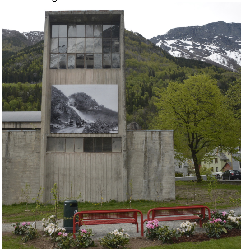
Utendørs fotogalleri på den nedlagte smelteverkstomta i Odda.

Norsk Vasskraft- og Industristadmuseum (NVIM) har som overordnet mål å formidle kulturminner fra vasskraft og industri inn i en ny tid, der den viktigste målgruppen er barn og unge. Knud Knudsen var en av Norges mest berømte fotografer, født i Odda. Han tok mengder av foto, ikke minst av Odda og området rundt, men også i andre deler av Hardanger. I jubileumsåret 2015 har NVIM sammen med Odda kommune laget en utendørs utstilling der store bilder fra Knud Knudsen sin samling er hengt opp på forskjellige bygg på Smelteverkstomta. Det er også planlagt å plante frukttrær i området i forbindelse med at Knud Knudsen også hadde utdanning innen hage og fruktdyrking. Jubileumsåret skal følges opp med tiltak som kan resultere i en sterkere identifisering med vår kulturhistorie.