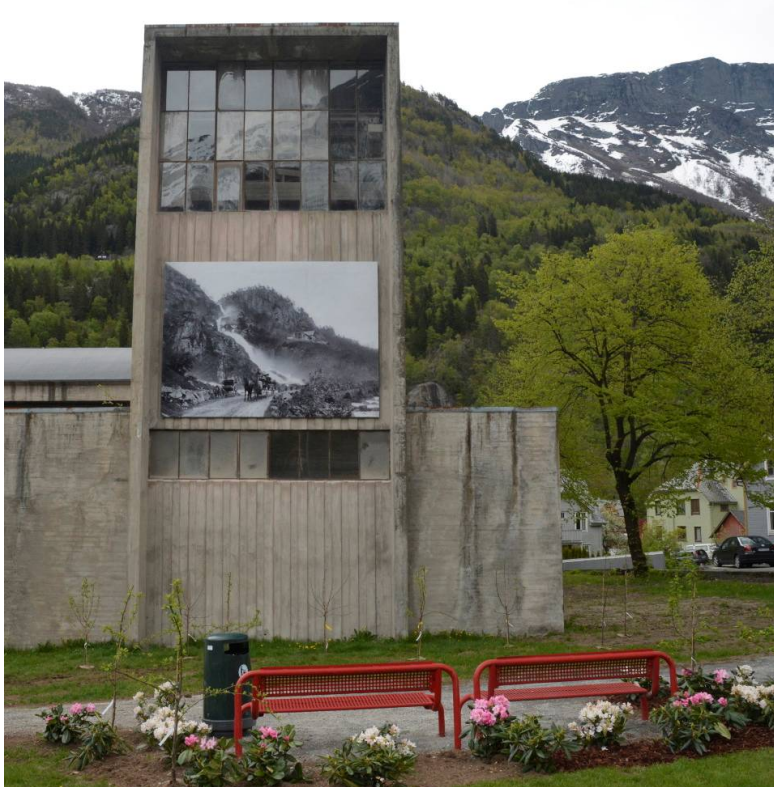
Utendørs fotogalleri på den nedlagte smelteverkstomta i Odda.

Norsk Vasskraft- og Industristadmuseum (NVIM) har som overordnet mål å formidle kulturminner fra vasskraft og industri inn i en ny tid, der den viktigste målgruppen er barn og unge. Knud Knudsen var en av Norges mest berømte fotografer, født i Odda. Han tok mengder av foto, ikke minst av Odda og området rundt, men også i andre deler av Hardanger. I jubileumsåret 2015 har NVIM sammen med Odda kommune laget en utendørs utstilling der store bilder fra Knud Knudsen sin samling er hengt opp på forskjellige bygg på Smelteverkstomta. Det er også planlagt å plante frukttrær i området i forbindelse med at Knud Knudsen også hadde utdanning innen hage og fruktdyrking. Jubileumsåret skal følges opp med tiltak som kan resultere i en sterkere identifisering med vår kulturhistorie.