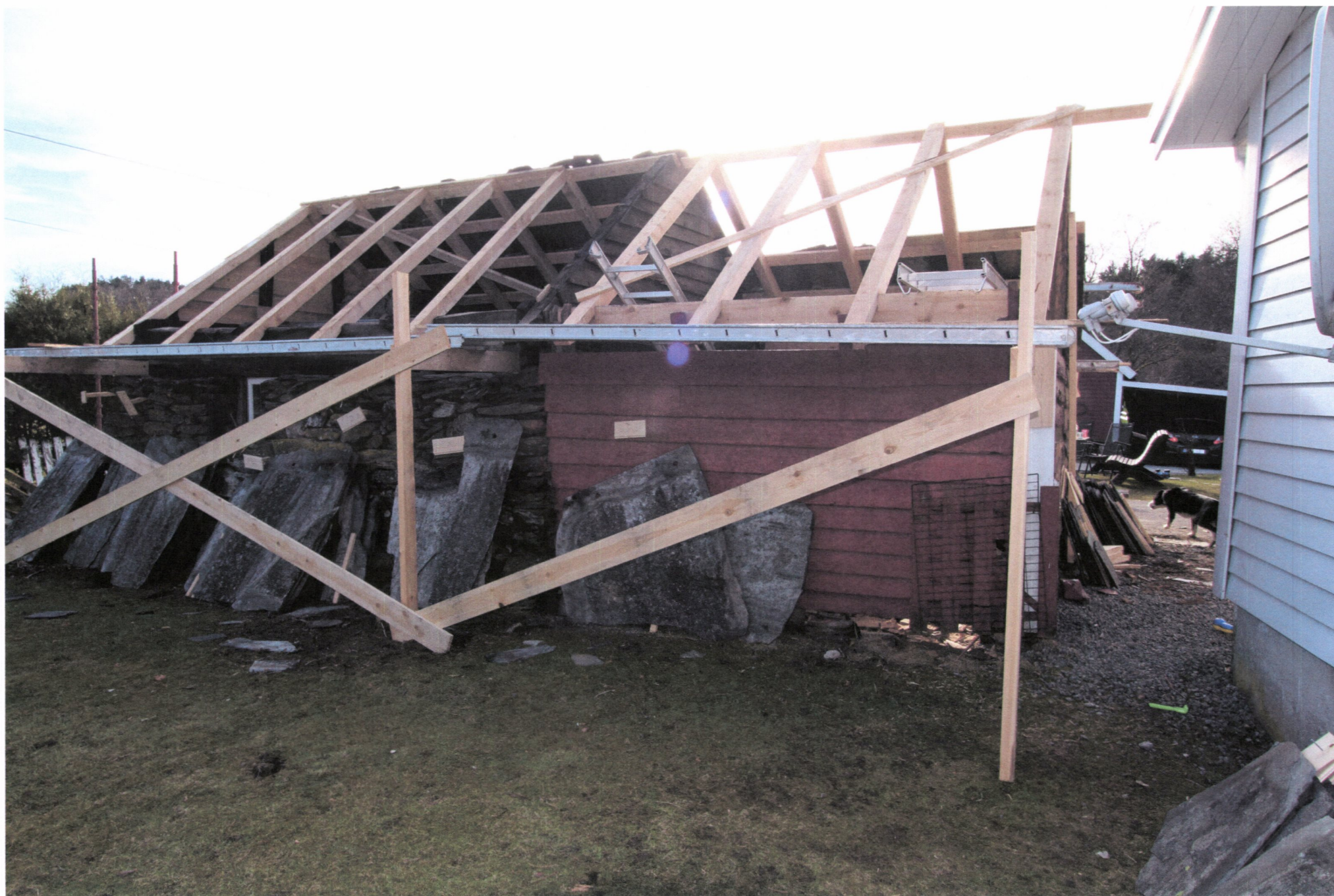
Nye taksperrer på plass