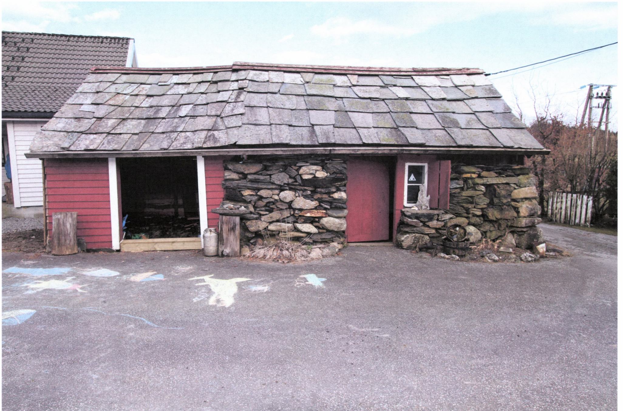
Eldhuset på Vatna slik det såg ut før restaureringsarbeidet