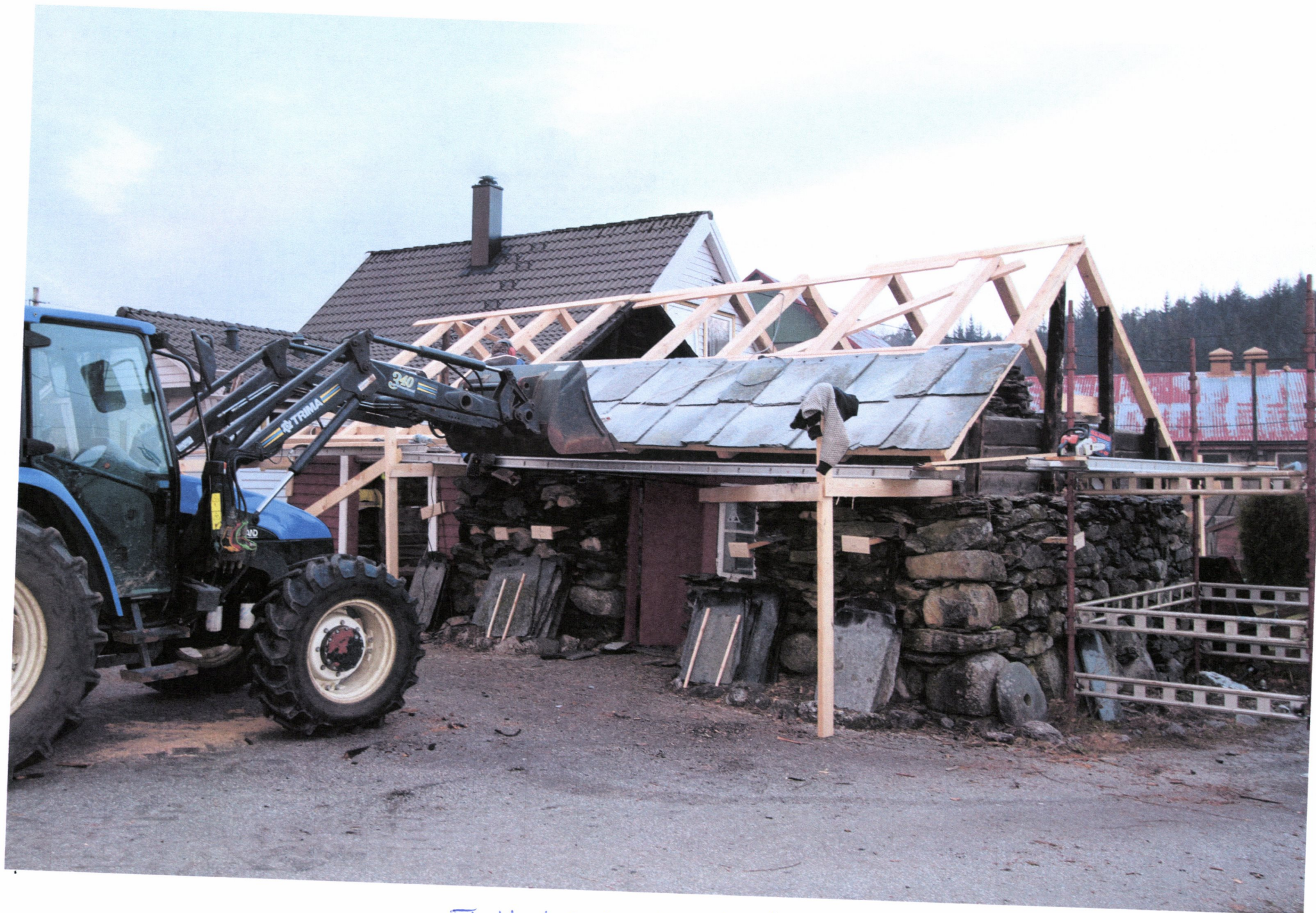
Flott håndverk arbeid