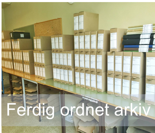
Ferdig ordnet arkiv