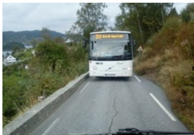
Selv med en liten utvidning, må det ofte rygges på denne uoversiktelige veien