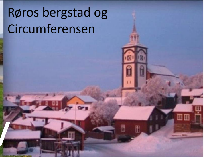
Røros bergstad og Circumferensen