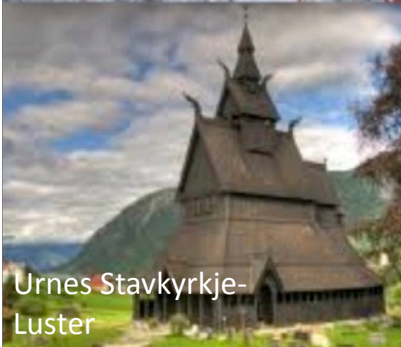
Urnes Stavkyrkje- Luster