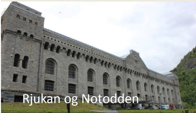
Rjukan og Notodden