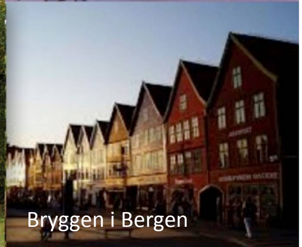
Bryggen i Bergen