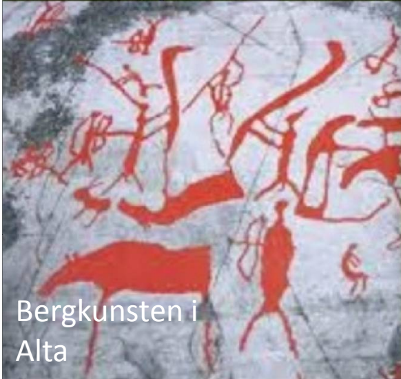
Bergkunsten i Alta