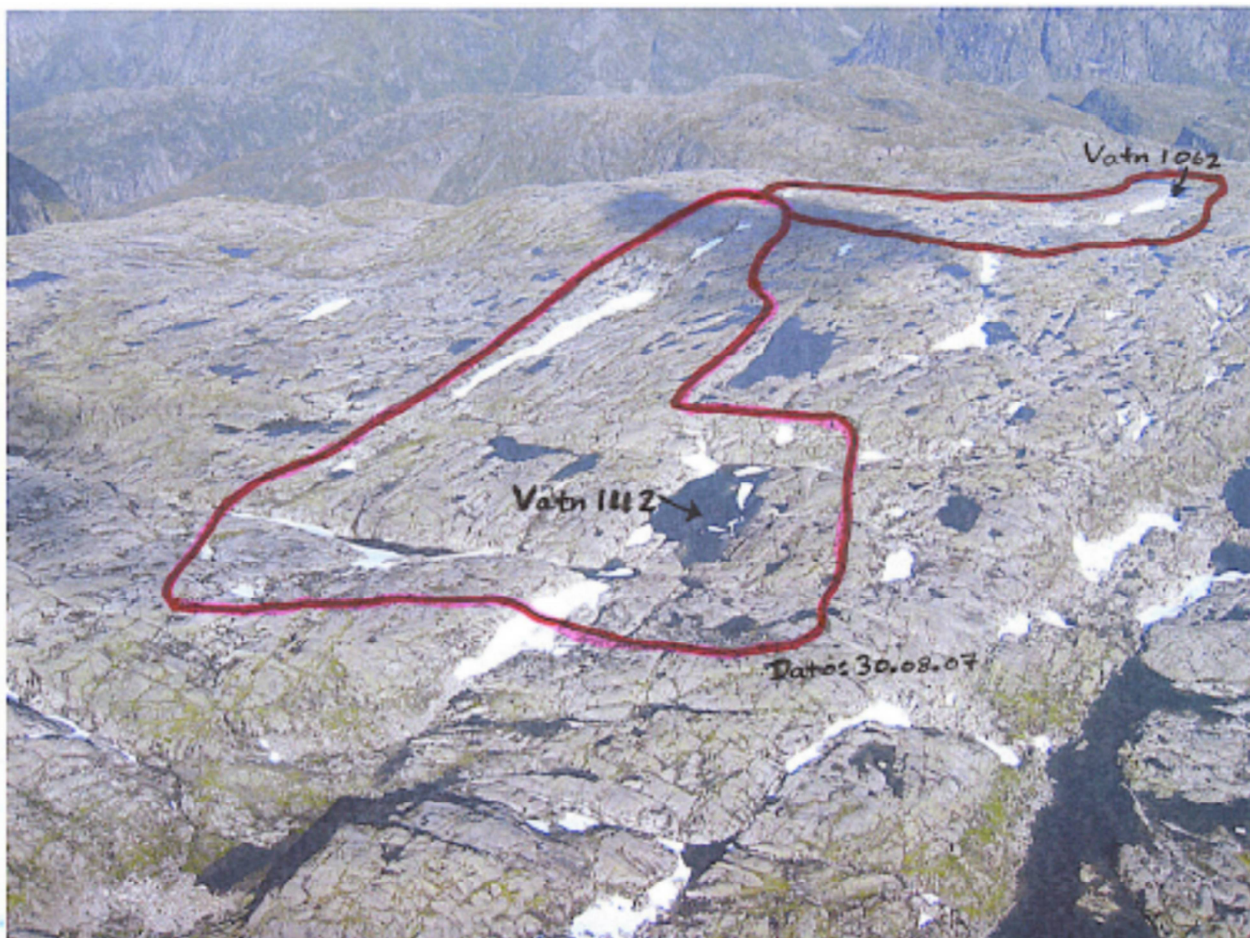
Fig. 2 Foto tatt mot nord frå helikopter 30.08.07. Feltgrenser er teikna inn.

Bekkar som vert påverka, er bekken ned frå Vatn 1062 som renn ned i Øyresdalen og møter elva frå Goddalsvatnet, og bekken frå Vatn 1112, som drenerer ned mot Austrepollen, der han møter Austrepollelva. Vassdraga er tidlegare regulerte.