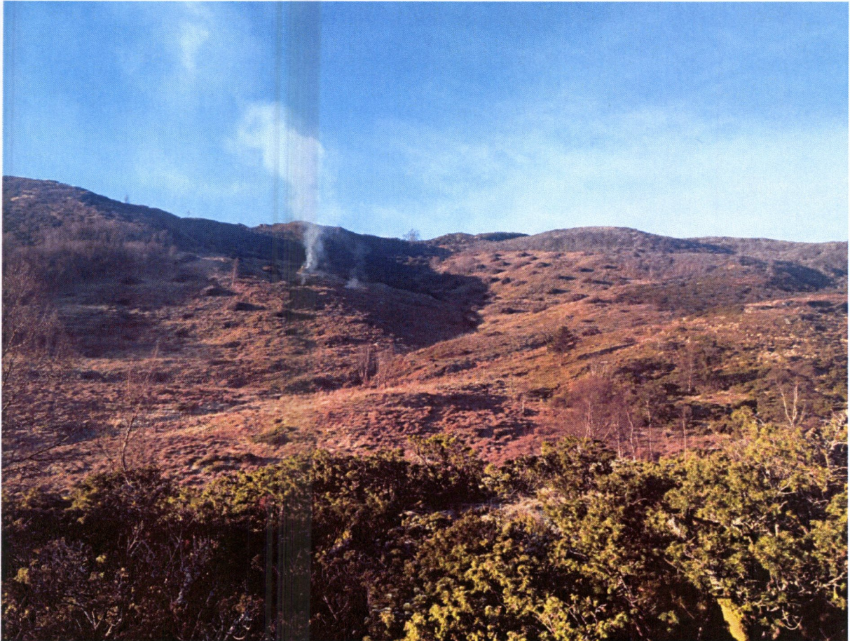
Frå ryddinga på vestsida av dalen.