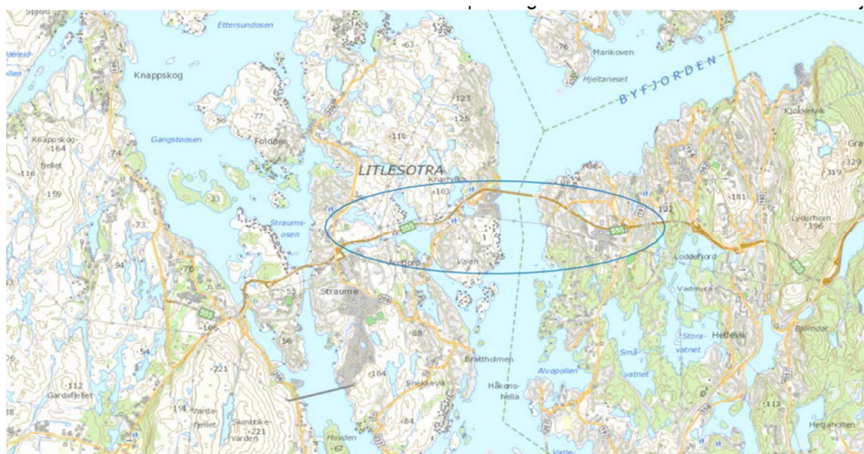
Fig. 1 Planområdet er ringa inn. Kommunegrensa mellom Fjell og Bergen går på tvers av Sotrabrua.

Tiltaket er lokalisert i Fjell og Bergen kommunar, frå Litlesotra inn i den eksisterande Sotrabrua til Drotningstveit. Planområdet er vist på fig. 1 under.