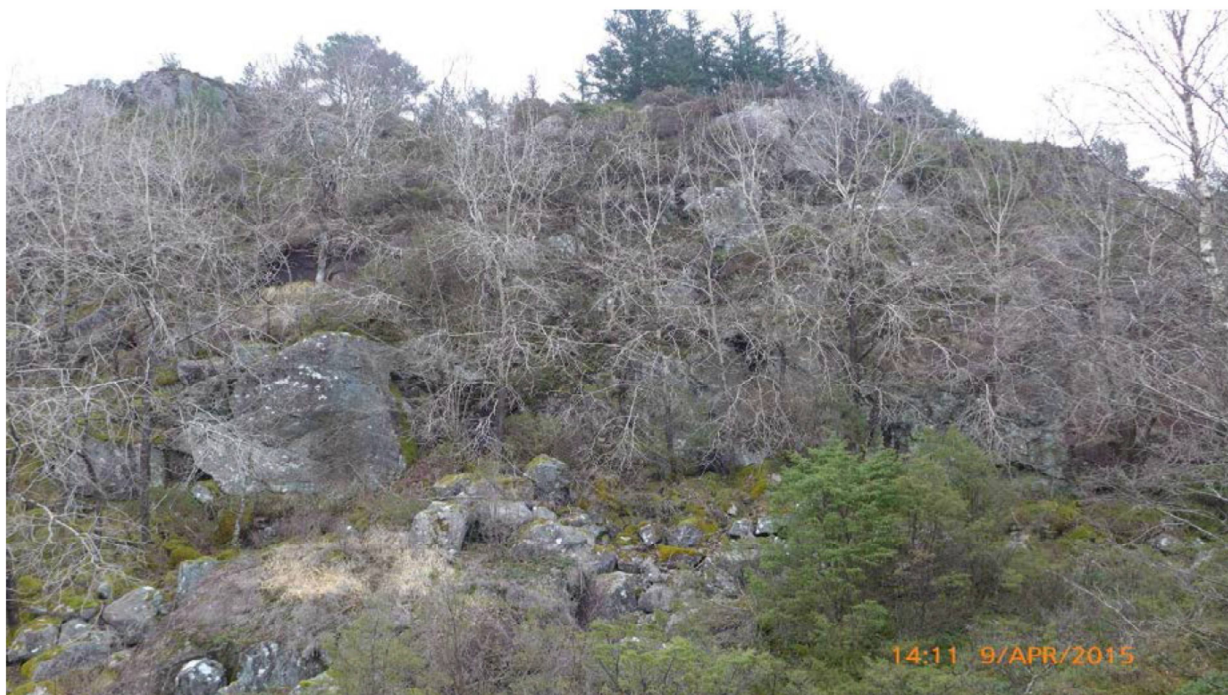
Fig. 4 Bilete av planlagt påhogg (tunnelinnslag) ved Arefjordpollen

Tiltakshavar gjer framlegg om avbøtande tiltak ved tunnelinnslaga i Drotningvik (natursteinsmur), Knarrvika (unngå nedspreging) og Arefjordpollen (muring og reetablering av vegetasjon).