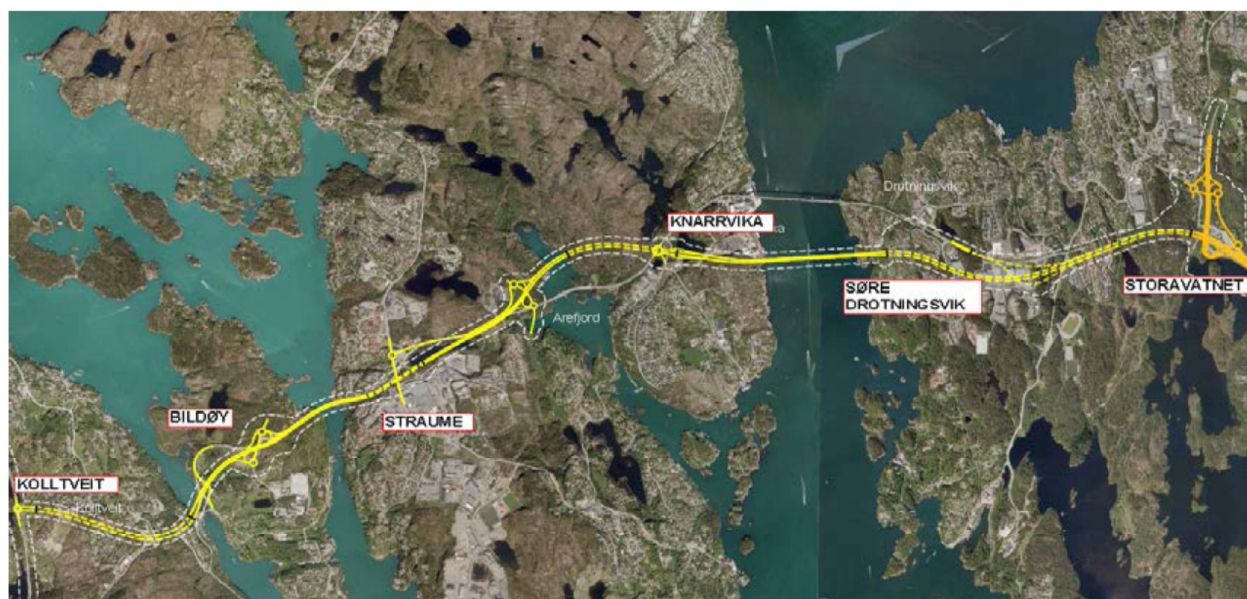
Fig. 3 Vedtekte vegtrasé for Rv 555 i kommunedelplanen