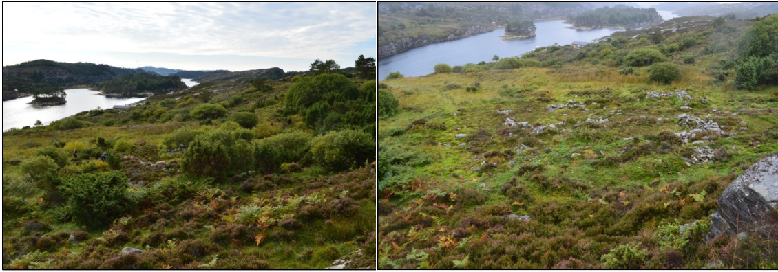
Tuftene på Høybøen før og etter skjøtsel.