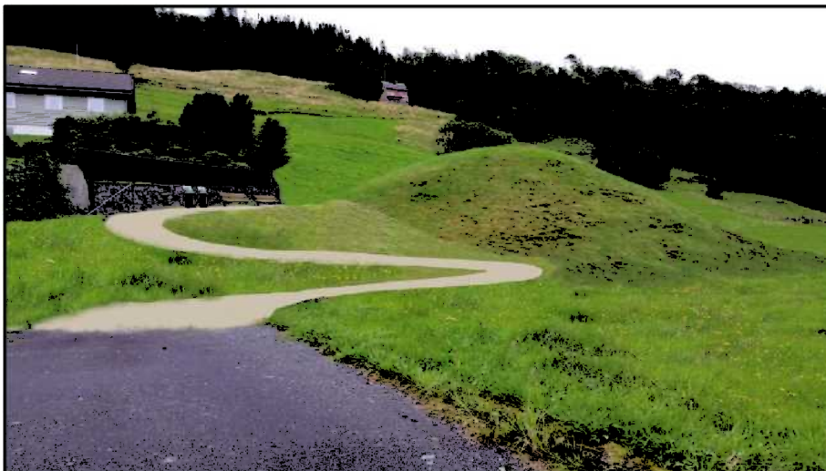
Illustrasjon frå søknad om korleis tiltaket er tenkt. Ved å fjerna murar og gjerder glir haugen meir inn som del av landskapet, og er tilgjengeleg for alle. (illustrasjon utarbeidd av Lindås kommune)