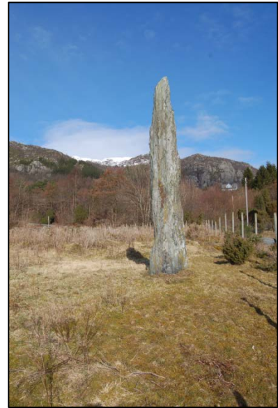
Bautastein på Årbakka.

Gravfeltet på Årbakka er eit strandgravfelt frå eldre jernalder med fleire bautasteinar og graver. Her har truleg vore 6-7 eller fleire bautasteinar, og minst 25 haugar, røysar og steinringar. Mykje av dette er fjerna, men det er framleis fleire synlege bautasteinar og gravminne. Det er i tillegg gjort motstandsmålingar i marka for å søkja etter kulturminne som ikkje er synlege på overflata. Det er markert fleire område som anten er kjente kulturminne eller som viser lokaliseringa til moglege kulturminne som ikkje er kjend gjennom skriftlege kjelder. Gravfeltet ligg rett ved Årbakka handelsstad og er tilrettelagt med skilt og parkering. Det vert gjort sporadisk skjøtsel og feltet vert tidvis beita med hest. Delar av feltet er tilgrodd.