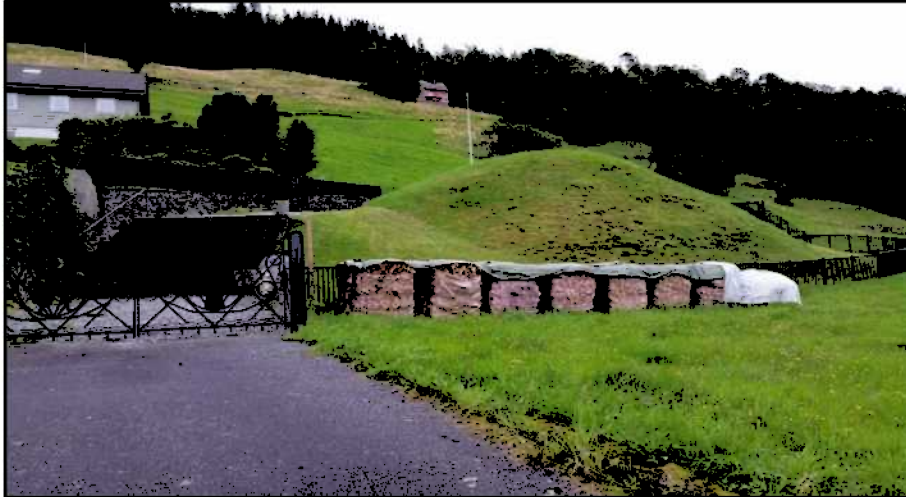
Kongshaugen i dag. Trappa gjer haugen lite tilgjengeleg for fleire brukargrupper.

Haugen er viktig del av bygdeidentiteten i området. Hordaland fylkeskommune er positive til fokuset på universell utforming. Detaljane kring gjennomføring og utforming må avklarast separat med fylkeskommunen som regional kulturminnemynde. Tiltaket vil krevja dispensasjon frå kulturminnelova og det er difor Riksantikvaren som har endeleg avgjerdslemynde i høve til tiltaket.