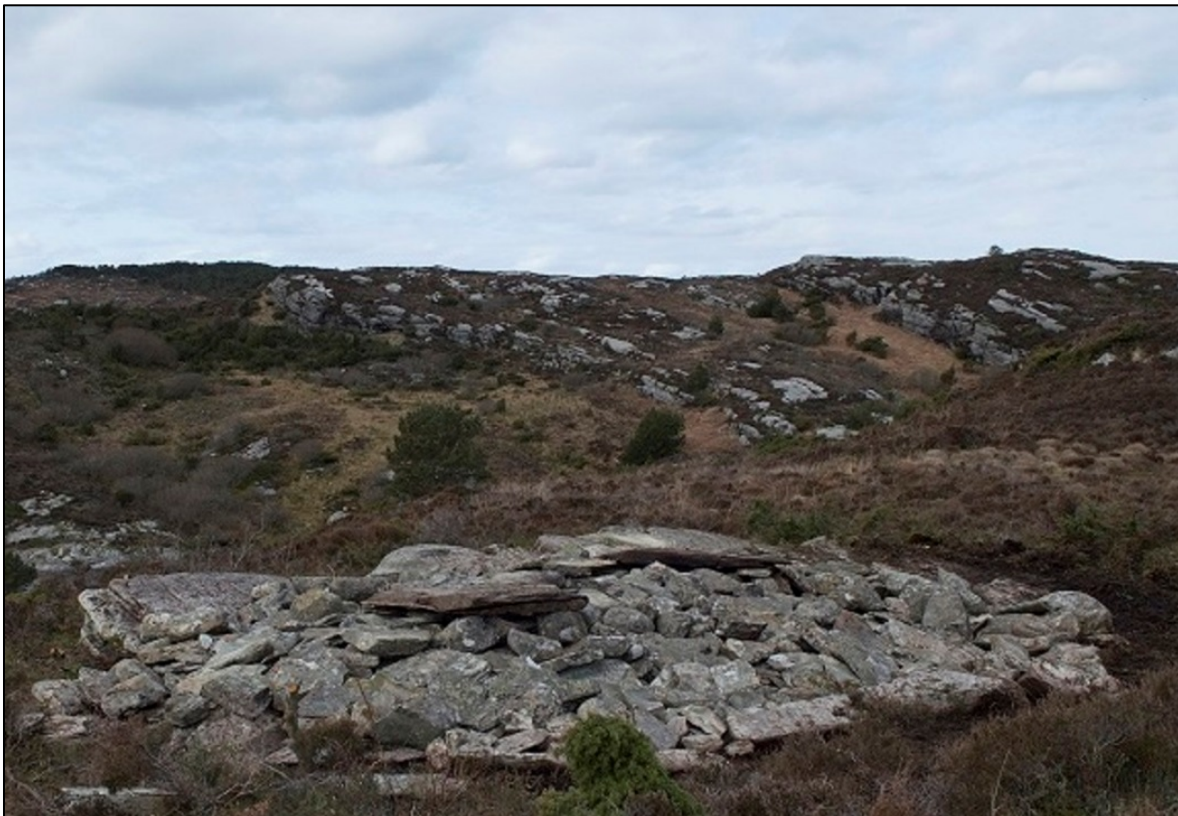
Under: Etter restaurering. Røysa vart restaurert av Hordaland fylkeskommune og Universitetsmuseet i Bergen i mars 2015. Restaureringa vart gjennomført som lekk i arbeidet med å formidla kulturminna i dette området.