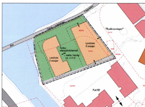
Figur 8.2. Illustrasjonsplan viser foreløpig planskisser for lavblokkalternativet.

Alt 2 gir en større byggehøyde mot allmenningen, 6 etasjer, mens gjeldende plan gir en avtrappet bebyggelse fra 6 til 3 etasjer nærmest vannet.