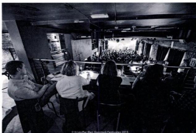
Årets jury på finaldagen, 5.juni 2015