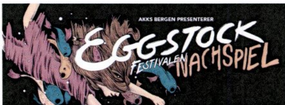
Bannere for Eggstockfestivalen 2015 sin facebook-side.