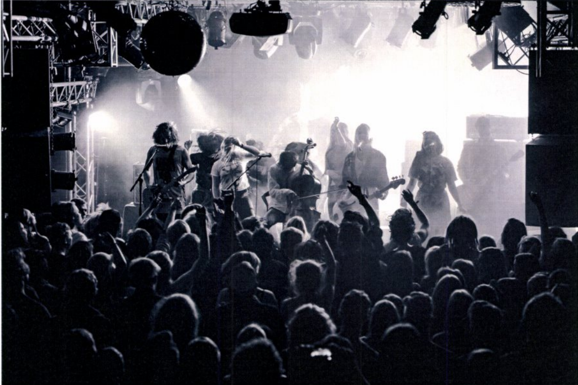
Honningbarna (og publikum) på scenen under Eggstockfestivalen 2015

Postadresse & besøksadresse: Georgernes Verft 12, 5011 Bergen