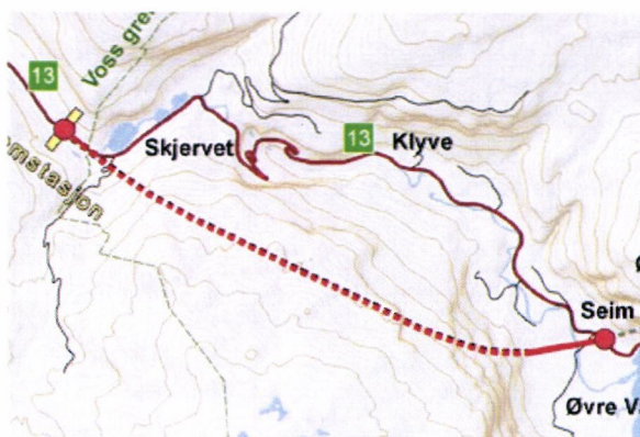
Viser nye Tunsberg tunnelen og gamle Rv 13 frå Voss grense til Seim

Tunsberg tunnelen erstatta eksisterande veg frå Moavatnet i Voss kommune, ned Skjervet og til Øvre Vassenden i Granvin herad og vart opna i desember 2011. Skjervet med Skjervsfossen er ein av innfallsportane til Nasjonal turistveg Hardanger og har i dag verdi som turistattraksjon. Nasjonale turistveggar ynskjer å utvikla og markera Skjervet med Skjervsfossen. Etter at Tunsberg tunnelen opna er gamlevegen framleis open for ferdsel og har nå så å seia berre turisttrafikk. Sjølve Skjervet er vinterstengd med bommar.