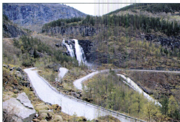
Skjervet med Skjervsfossen i bakgrunnen

Postadresse Statens vegvesen Region vest Askedalen 4 6863 Leikanger