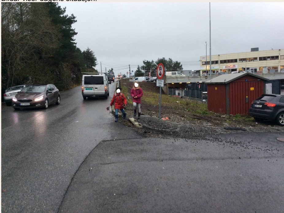
Bildar viser dagens situasjon.