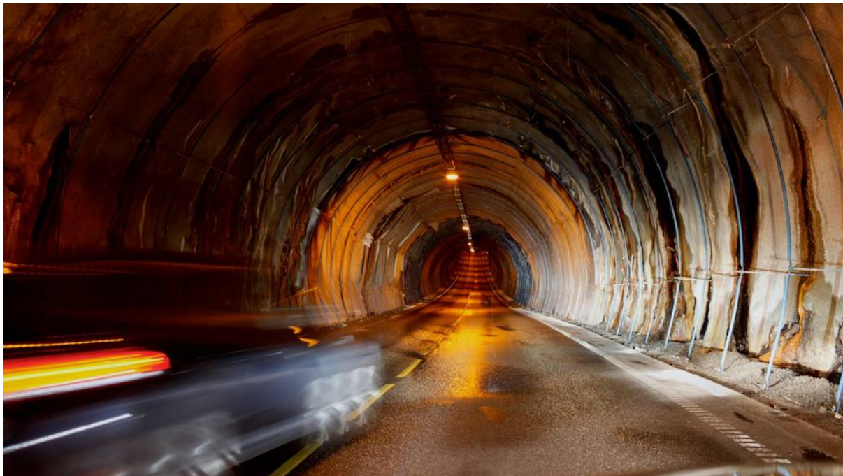
Bjørøytunnelen.