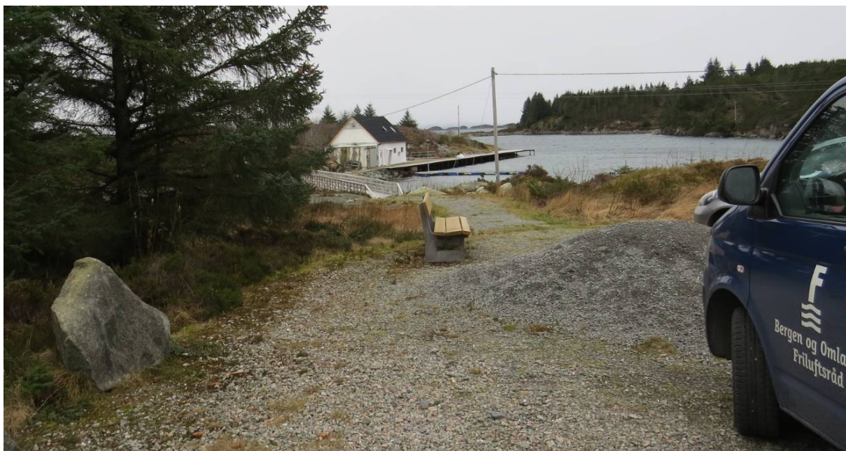
Mot tilkomsten til Sveholmen – litt av parkeringen