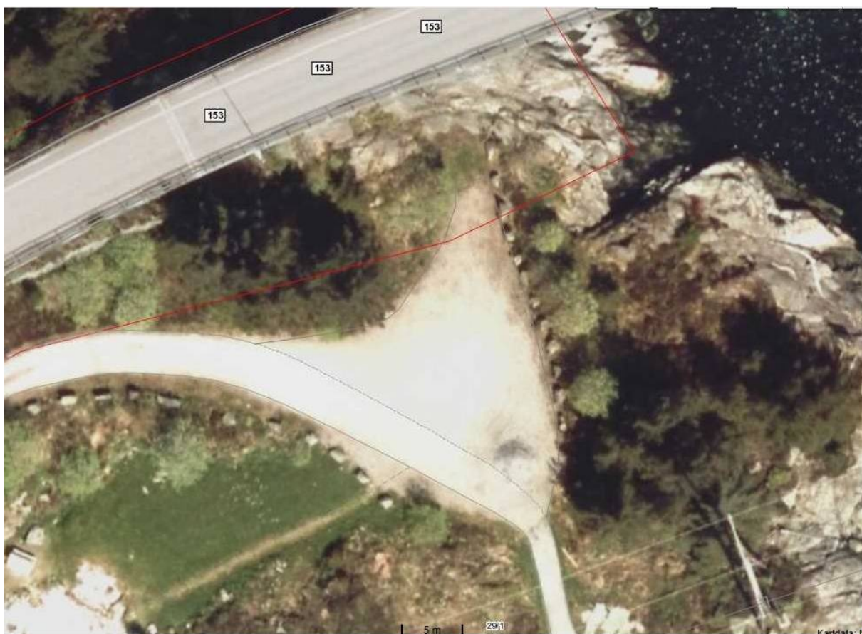
Parkeringen og veien