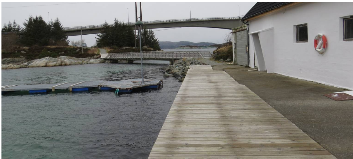
Sett fra Sveholmen