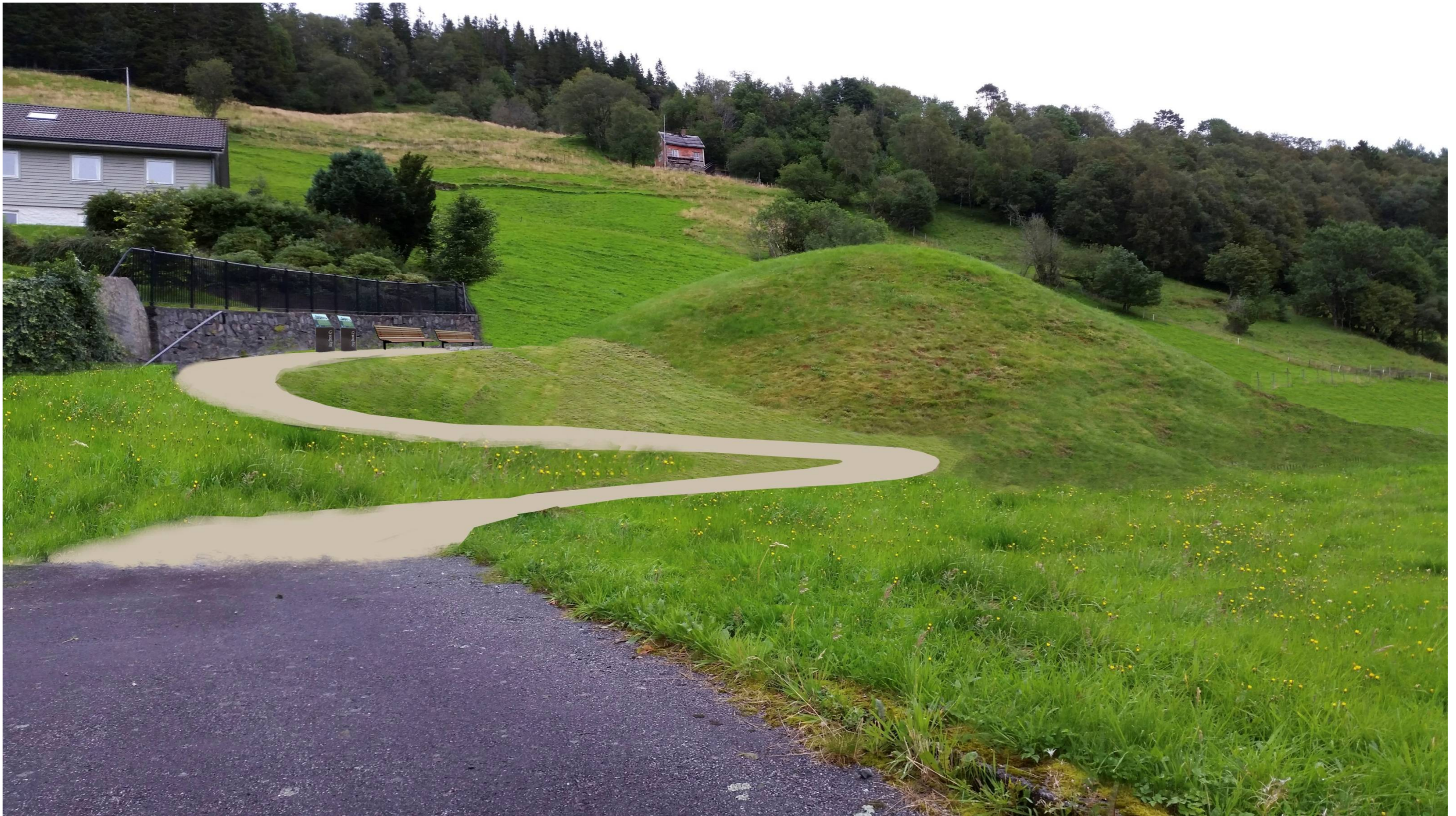
Håkonshaugen – Visualisering; Framlegg til ny utforming ved tilkomst –trapp og gjerder er fjerna, nye benkar og infotavler.