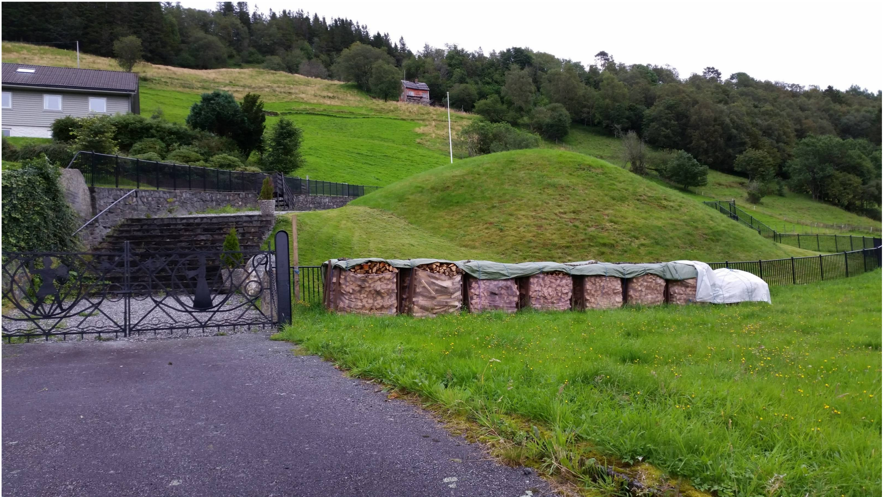
Håkonshaugen - Eksisterande situasjon med trappetilkomst, murar og gjerde som innramming av haugen.