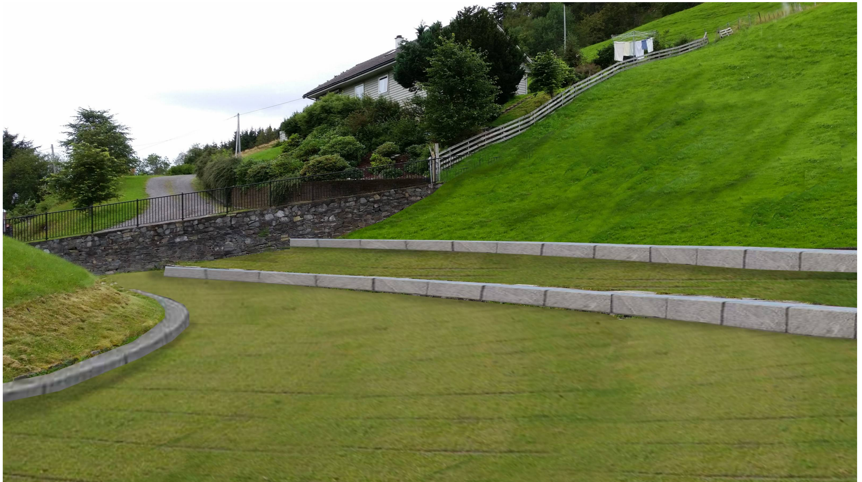
Håkonshaugen – Visualisering: Framlegg til ny terrengtilpasning og nye overflater med grasarmering på 2 platå og sittekanter