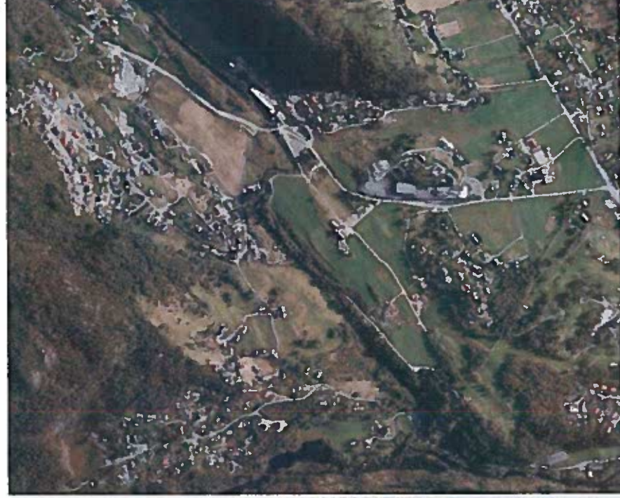
2. Hatvikvegen – Valla bru (langs Hegglandsdalsvegen), Ca. 910 meter lengde