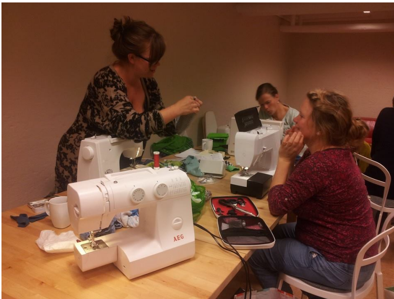
Kunnskap deles: Vi hjelper og lærer av hverandre. Og koser oss!