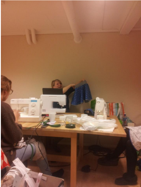
Skjørt av gammel gardin.