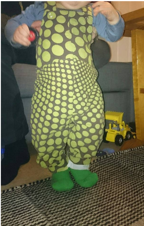
Selebukse av skjørt.