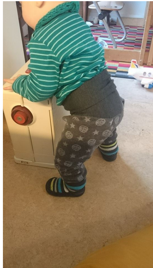
Ullbukse av mammas gamle ulltrøye.