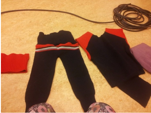
Ullgenser (voksen) transformeres til tjukk ullbukse til toåring.

Presentert under er noen av syprosjektene som ble gjennomført ved redesignkurset. På kurset ble vi kjent med nye teknikker og smarte triks for å bruke gamle plagg/stoffer til å skape noe nytt og praktisk!