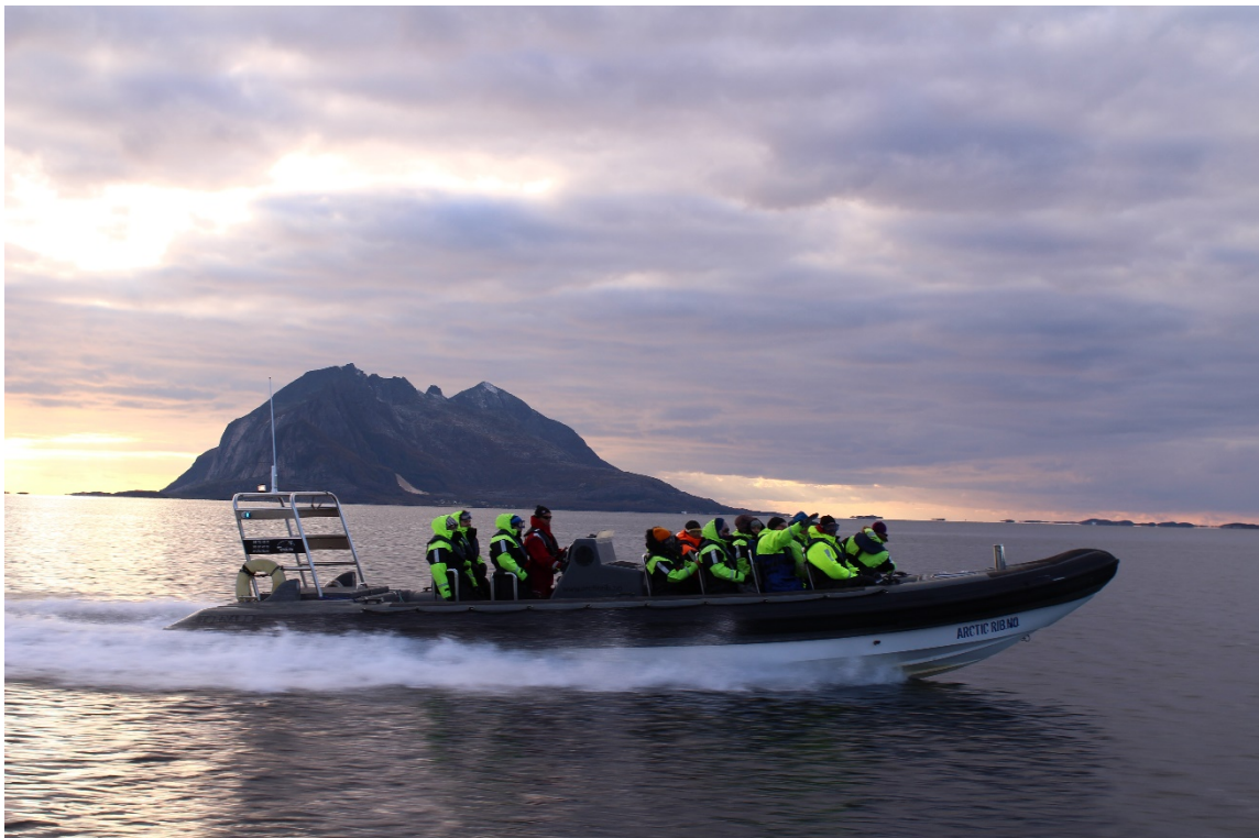
Akvakulturfagmiljøet i fylkeskommunene på fagsamling i Bodø høsten 2014.

For mer utfyllende beskrivelse av resultatmålene vises det til rapporten fra forprosjektet, side 5 og 6.