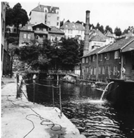
Foto av Dikkedokken ca. 1957

Det er viktig å få bevart Dokkehuset gjennom bruk, men Fylkesrådmannen stiller spørsmål om bustad er rett føremål, då det vil verke privatiserande i høve til å gjere dokken almen tilgjengeleg. Bygningen bør difor integrerast som ein del av eit felles byrom, for å styrke dokken sin opplevings- og bruksverdi.