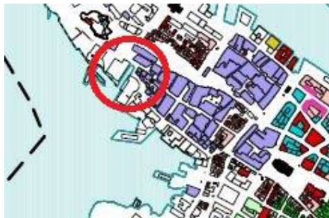
Utsnitt av KDP Sentrum sitt plankart nr. 2 «byform-bebyggelse».

Følgjande retningslinjer som set fokus på utfordringar for utvikling av område og utarbeiding av plan gjeld: Nye byggeprosjekt skal «sikre gode sammenhenger mellom den verneverdige boligbebyggelsen, den øvrige bebyggelsen og de offentlige arealene mot sjøfronten.»