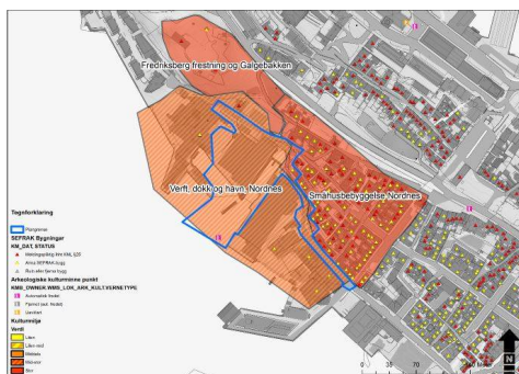
Figur henta frå kulturminnedokumentasjonen. Planområdet vist med blå linje. Kulturminneverdiar er vist med farge.

Dokkanlegget i planområdet er truleg Noregs eldste sivile tørrdokk og har difor høg regional verneverdi. Sjølv dokkehuset har òg kulturminneverdi, sjølv om det er kraftig bygd om, då det er ein del av dokkanlegget. Dei fire Kjødehallane består av tre industrihallar frå 1950-60-talet og ein open stålkonstruksjon, anlagt i same område der bygningane for det gamle verftet låg. Desse hallane har kulturminneverdi, men kan tåle transformasjon.