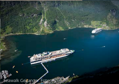
Seawalk Geiranger.