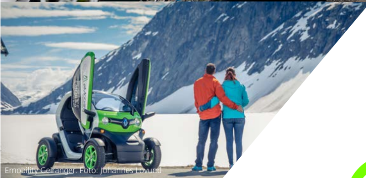
Emobility Geiranger.