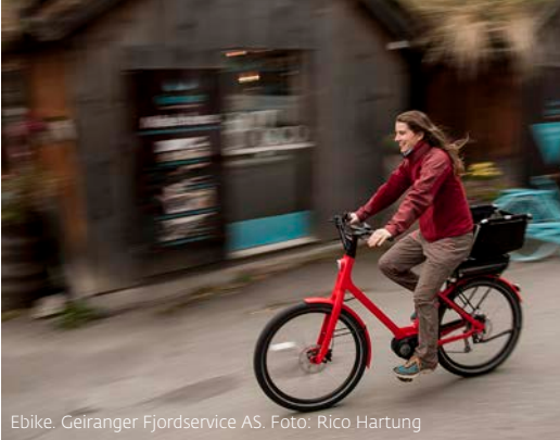
Ebike. Geiranger Fjordservice AS.