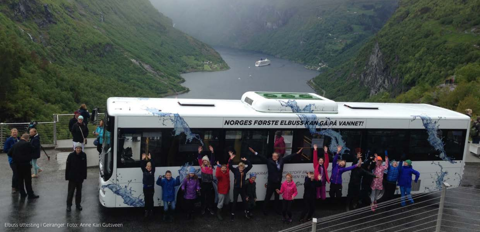
Elbuss uttesting i Geiranger.