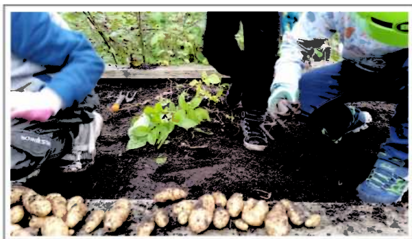
4. klasse-gutar haustar mandelpoteter

Bergen kommune hjelper oss med jord og gjødsel, og me har fått pallekarmar av lokale entreprenørar. Nordneshallen har ei redskapsbod med ein del hageutstyr som me fritt får låna, samt at dei sørgjer for at vannkrana til ei kvar tid fungerer.