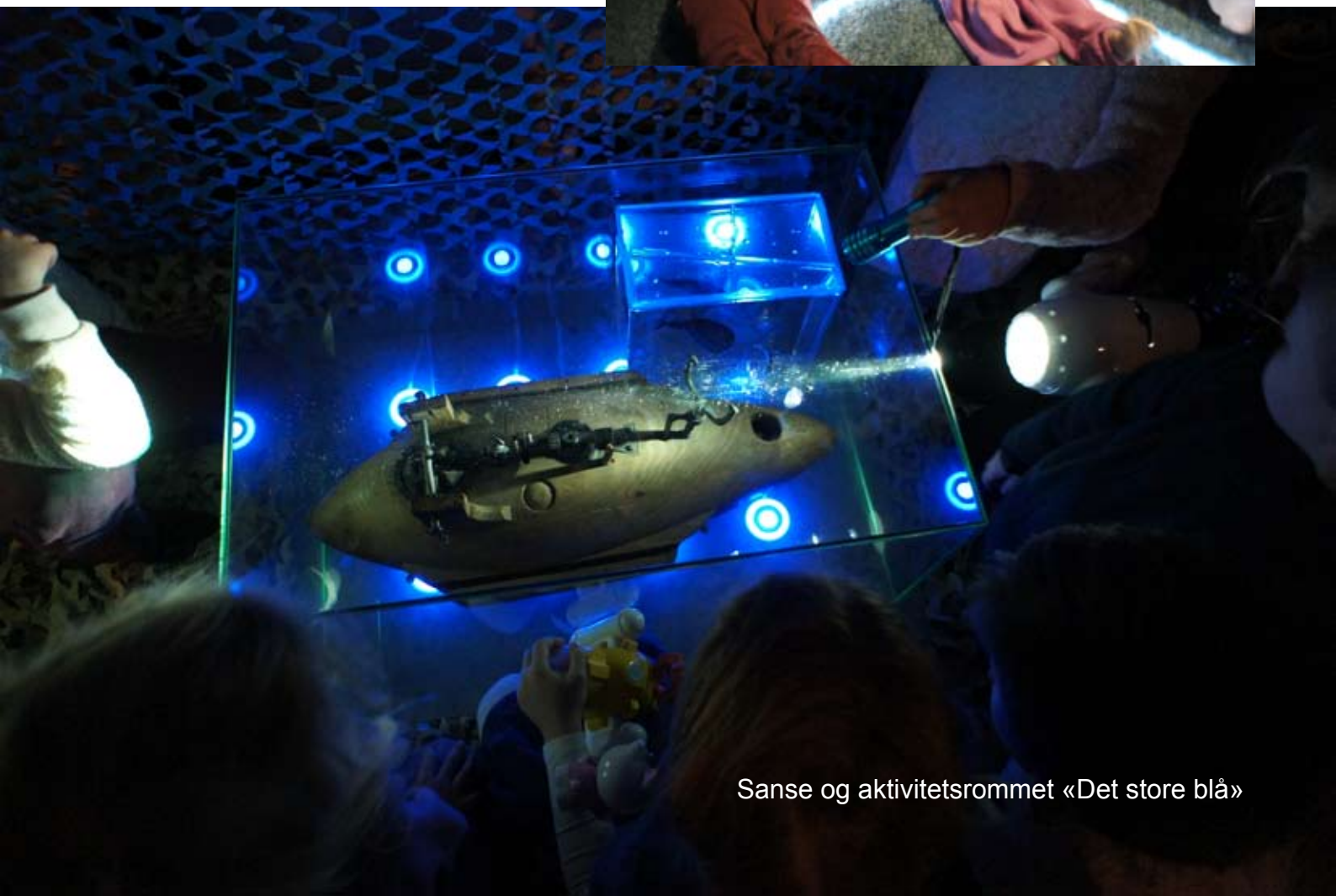
Sanse og aktivitetsrommet «Det store blå»