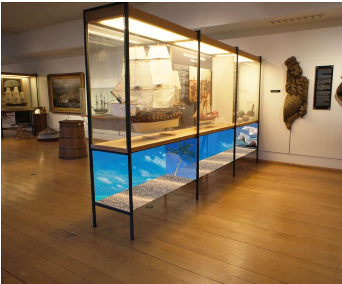
Fotomanipulert skisse. Publikumsgenerert utstilling under seilbåtene.

Eller under en modell av de mange seilskipene - et eksotisk sydhavsmiljø med mulighet for å leke eller å lage elementer til miljøet; palmer, bananer, apekatter... Vi bygger videre på monterets beinkonstruksjon og i en kasse med sand befinner det seg kanskje spennende skatter... Mulighetene er mange og ønsket er å utvikle ideer i dialog med publikum.