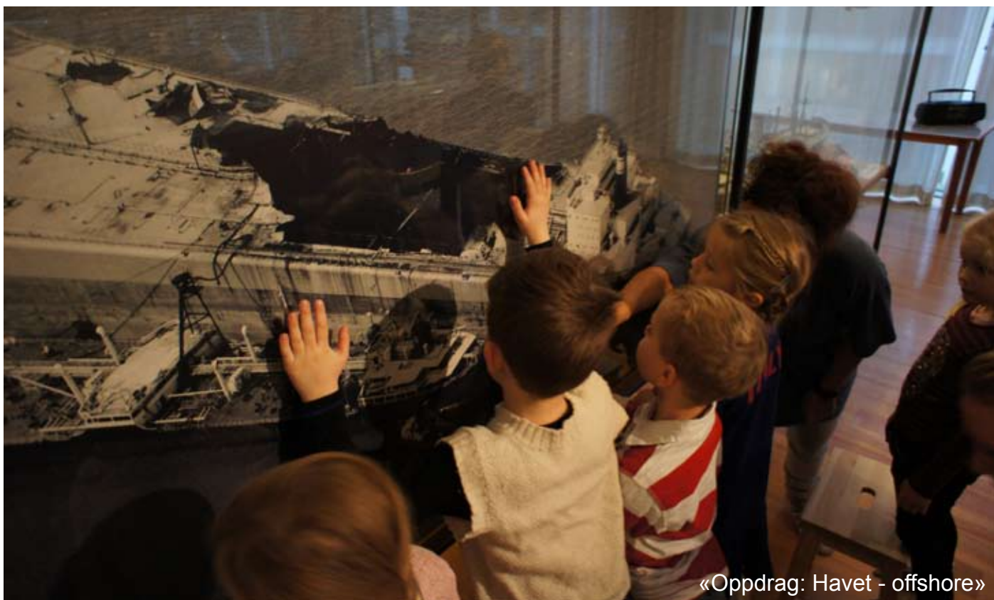
«Oppdrag: Havet - offshore»

«Livet på havet» er et svar på formidlingsopplegget «Oppdrag: Havet - offshore» (støttet av DKB og rettet mot barnehager). I møtene med barna og museumsobjektene har vi sett hvor engasjert barna blir når de gis anledning til å studere båtmodellenes detaljrikdom. De er ivrige formidlere, spørsmålsstillere og fortellere. Museets utfordring er å legge til rette for at deres stemmer, erfaringer og innspill gis handlingsrom.