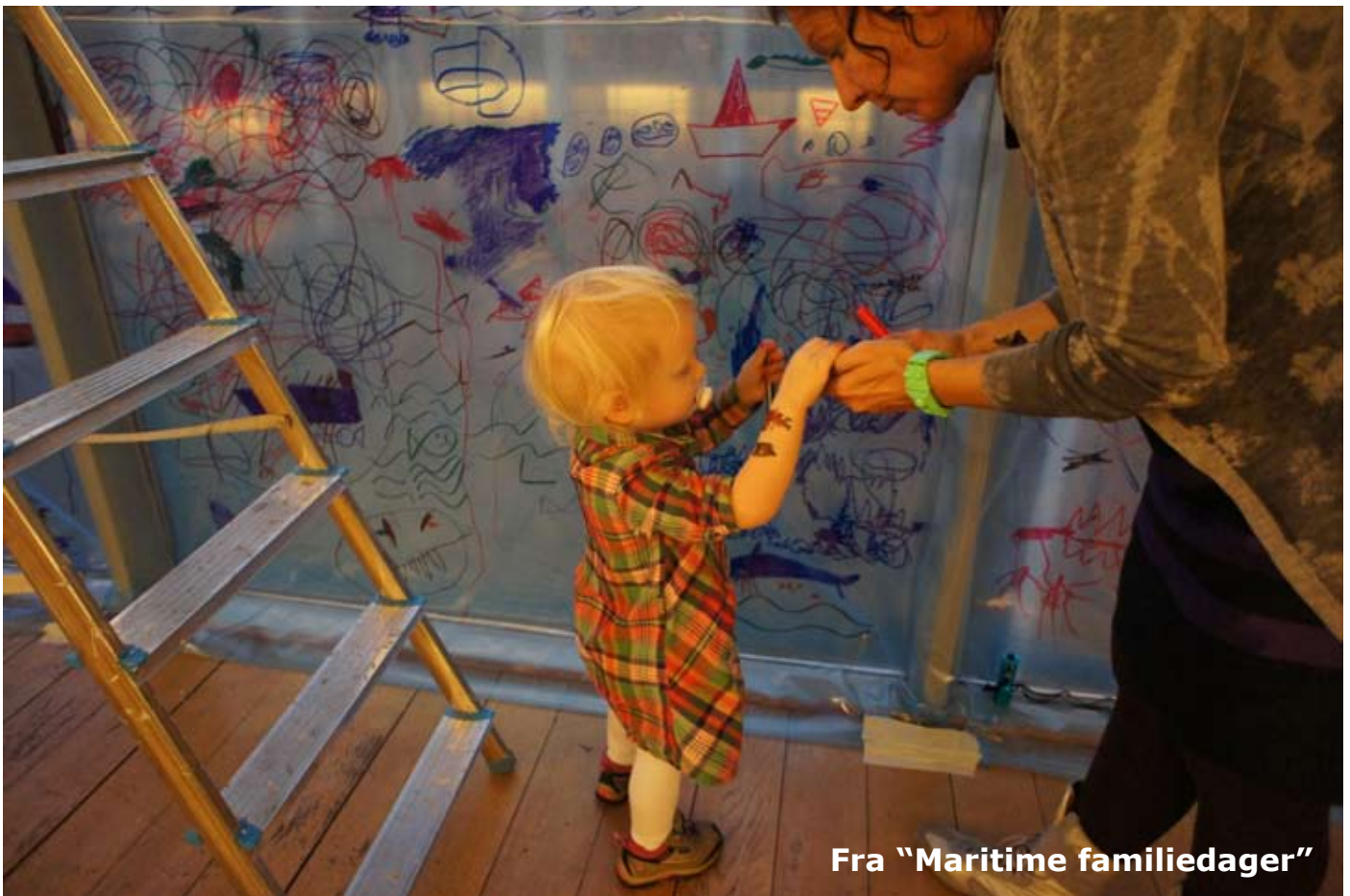
Fra "Maritime familiedager"

I nærheten av modellen samler vi oss rundt og gjerne også på, et kjempestort tegneark. Som del av et designforløp prater og skisser vi mulige løsninger og objekter for utstillingen.