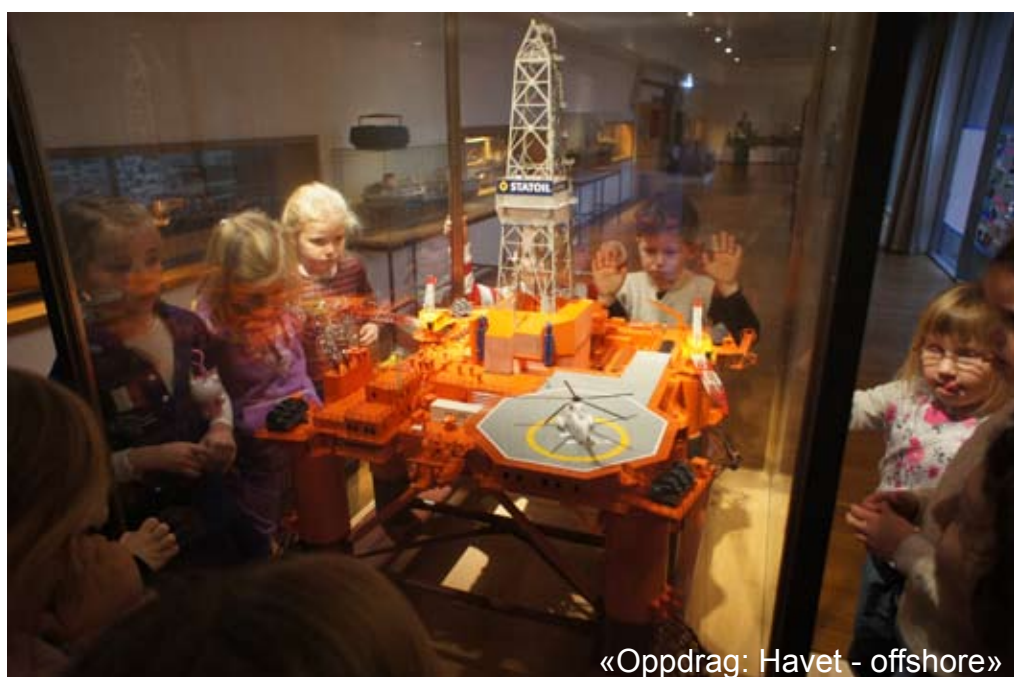
«Oppdrag: Havet - offshore»

Normalsituasjonen for barna er imidlertid at museumsobjektene gjerne er utenfor deres rekkevidde – både ved at de ofte befinner seg bak glass og at utstillingshøyden er tilpasset et voksent publikum. Flytter vi deler av utstillingen ned i monterets underetasje samt gir barna muligheten til å sanse, utforske, leke og lage på dette området skjer det kanskje også noe med de voksnes blikk. Det er ikke bare barn som setter pris på hands-on opplevelser og kreativitetsutfoldelse på museer. Flere innganger til museums- og kunnskapsformidling kan bidra til økt nysgjerrighet og trivsel hos alle.