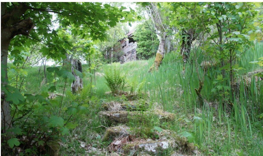
2013. intrikat . Foto på gjennomlysende tekstil. 200x115cm

Tegninger og collage fungerer som inspirasjonskilde til prosjektet, i tillegg til min tidligere utstilling 'intrikat' ved Hordaland museumssenter som undersøker hvordan omgivelsene forandres når vareproduksjon flyttes til utlandet.