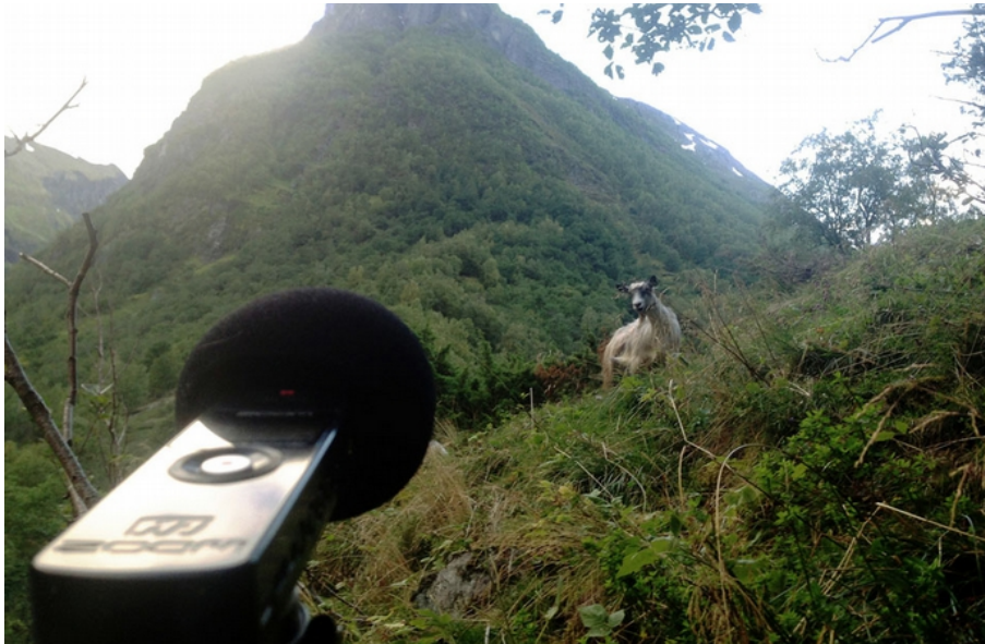
2015. Feltarbeid – lydopptak i Undredal.

Absens er ikke et nostalgisk tilbakeblikk men retter fokus mot fremtiden: Hvordan ønsker vi at landskapet og infrastrukturen organiseres? Kan det tenkes andre visjoner i forhold til dagens utvikling? Verket ønsker å animere en felles hukommelse med fokus på det særegne og lokale i en global kontekst.