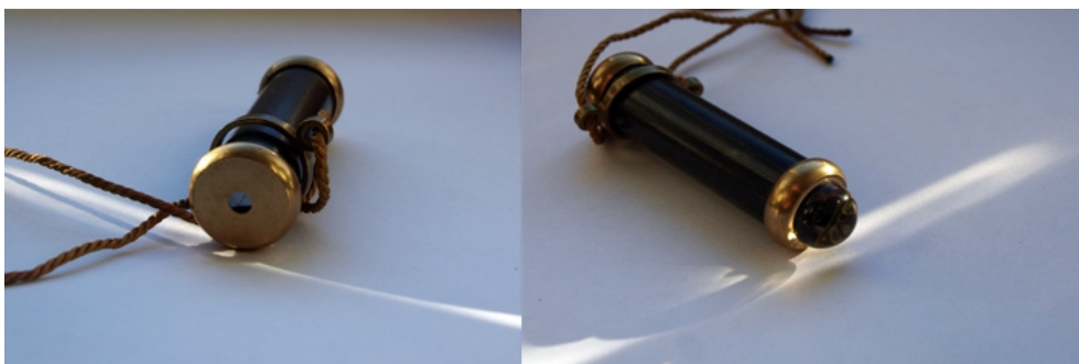
Prototype av kaleidoskop, bestående av et metallrør, speil og glass. Her som miniatyr.