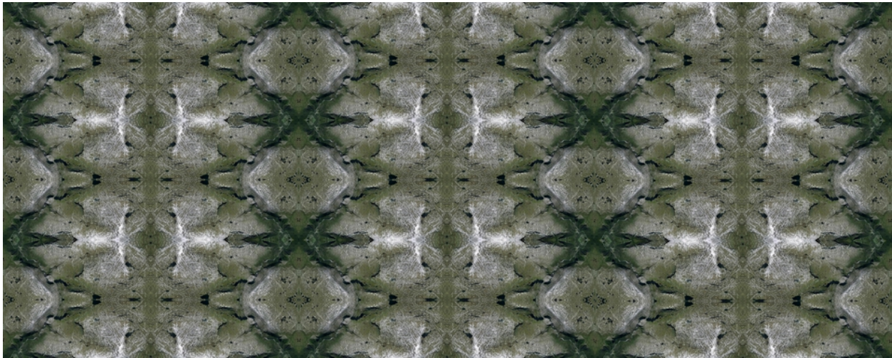
2015. Kaleidoskopisk Stavali . Collage, digital trykk