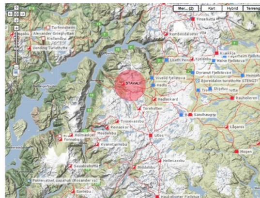
Stavali er del av Hardangervidda nasjonalpark. Beliggenheten er markert i rødt.