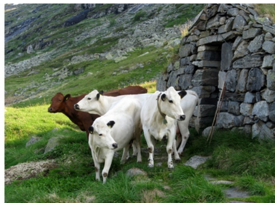
Bilder fra Stavali i 2008. Stølsdriften ble nedlagt for fire år siden, gården har vært i drift siden 1600-tallet. Nå står husene tomme eller brukes av besøkende til overnatting.