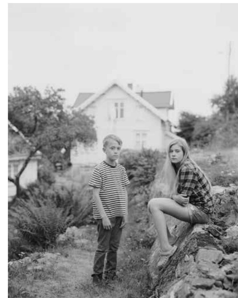
Venstre oppe: Utsikt fra Bykle. Setesdal 2014. Lengst t.v. nede: Bonde i Helle. Setesdal 2014. Venstre nede: Ung korpsmusikant i Bykle. Setesdal 2014. Under: Pike i Setesdalsdrakt. Setesdal 2014. Over: Skipskransholmen ved Svinør. Vest-Agder 2013. Høyre: Unge i Svinør. Vest-Agder 2013.