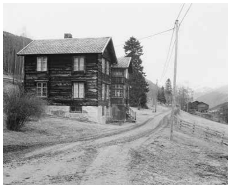
Gård i Romsdalen. 2013.