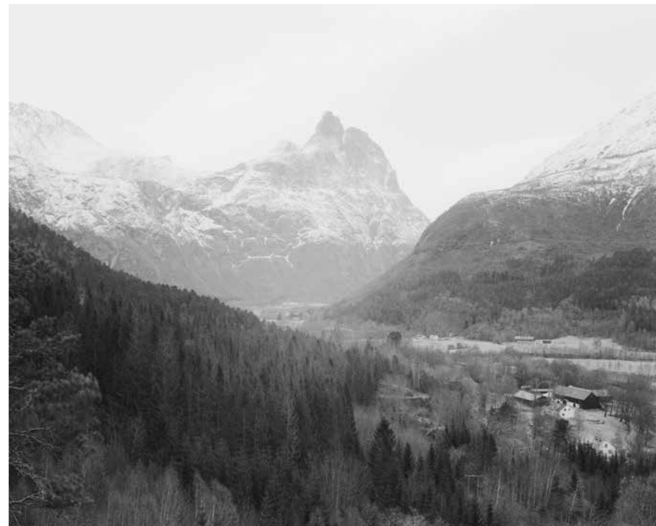
Utsikt mot Romsdalshorn fra Mjølva ved Åndalsnes i Romsdalen. 2014.