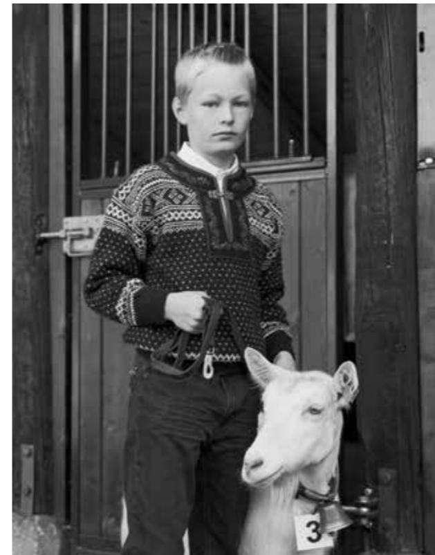
Gutt med geit på Dyrsku'n i Seljord. Vest-Telemark 2013.

I prosjektet er Berti opptatt av temaene identitet og verdier i vår tid, satt i et større perspektiv med forbindelseslinjer til fortid og et blikk mot framtid. I motivvalgene søker han etter symboler på kontinuitet med fortiden og tradisjoner overlevert gjennom generasjonene. Samtidig viser han tydelig nåtid. Med sitt eget blikk ønsker han å bruke fotografiet til å skape et historiedokument for ettertiden.