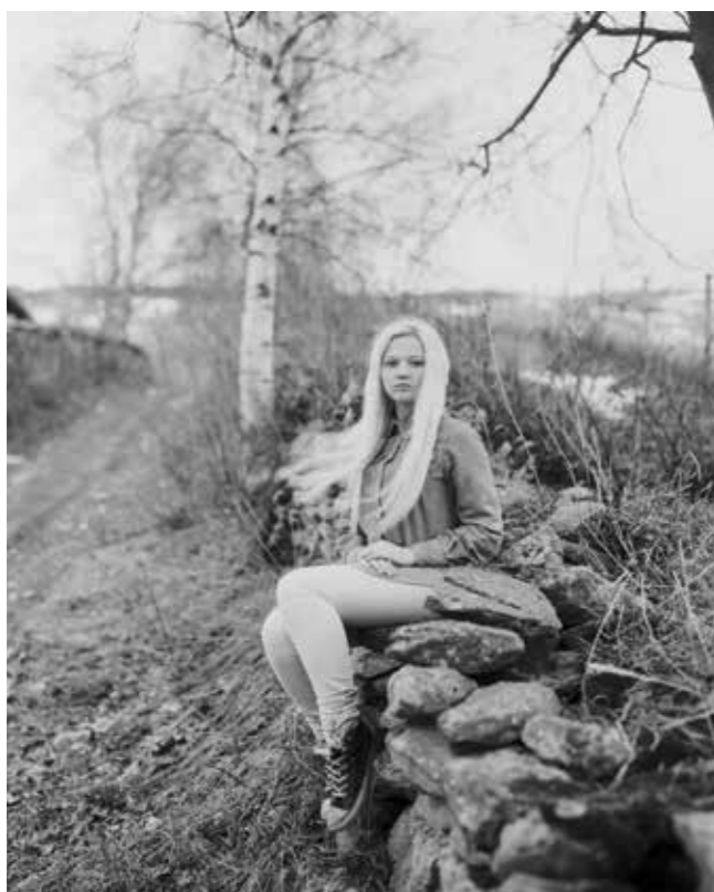
Jente ved prestegårdsvei i Hundorp. Gudbrandsdalen 2014.