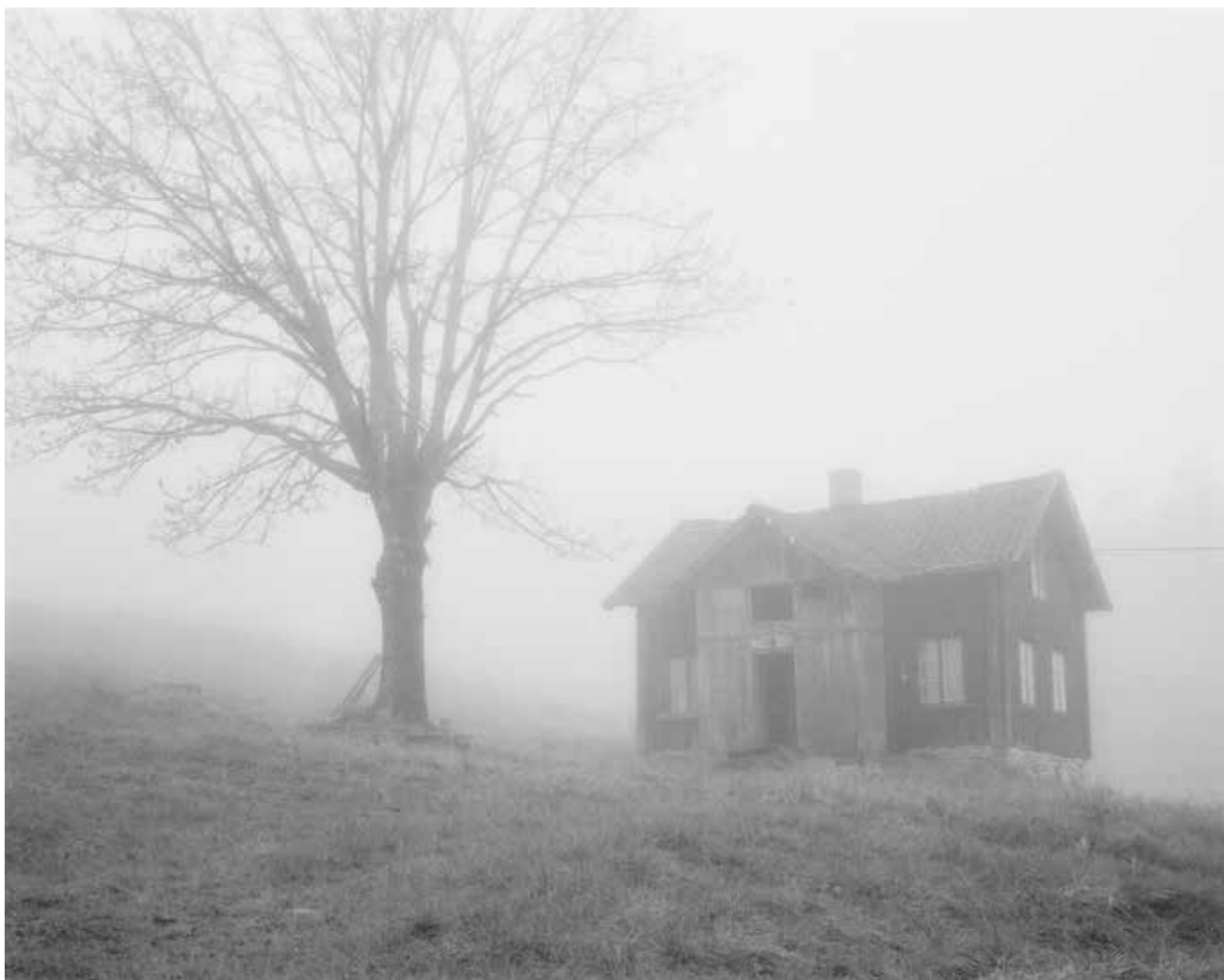
Forlatt gård på Vestsida, ved Notodden. Telemark 2013.