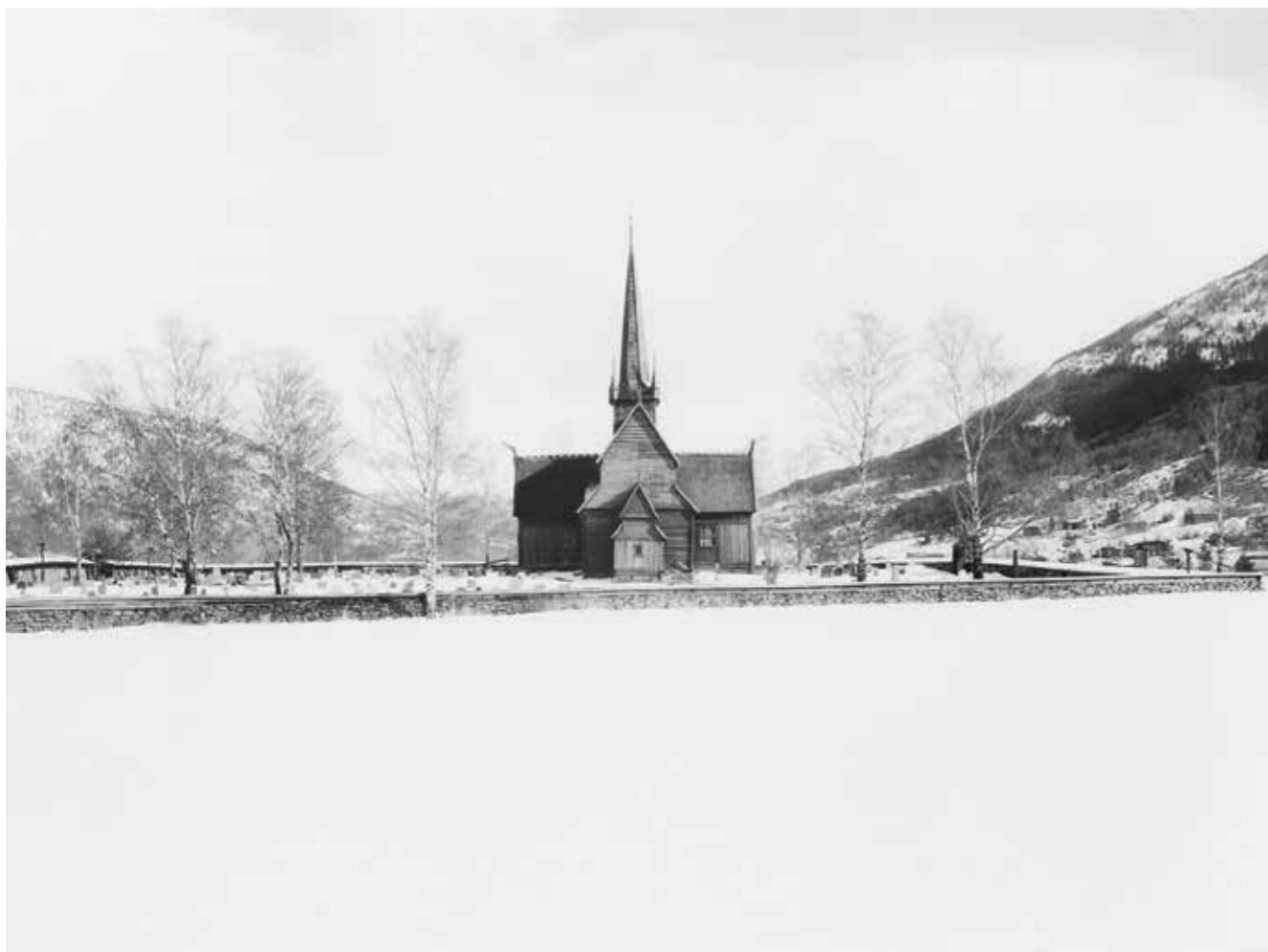
Lom stavkirke. Gudbrandsdalen 2014.