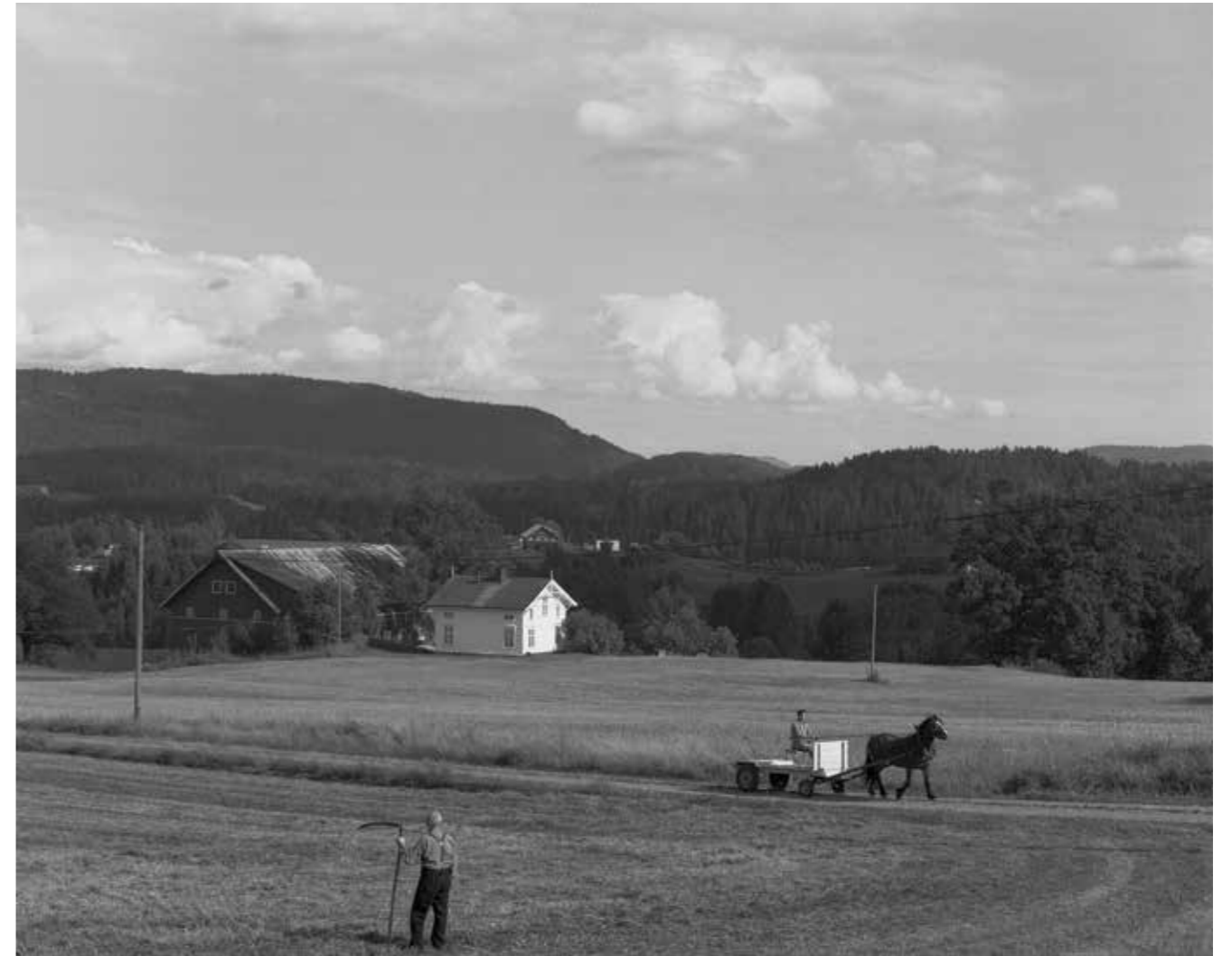
Ljåslått i Lunde. Midt-Telemark 2013.