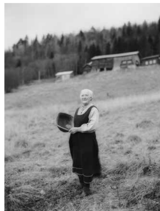
Gårdskvinne i Rauland. Vest-Telemark 2013.