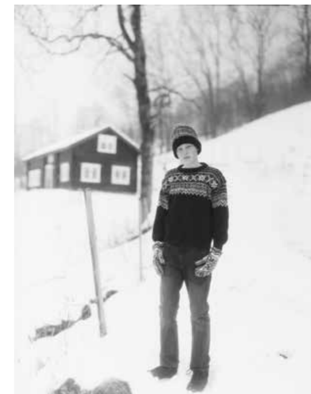
Gutt ved Isfjorden. Romsdal 2014.