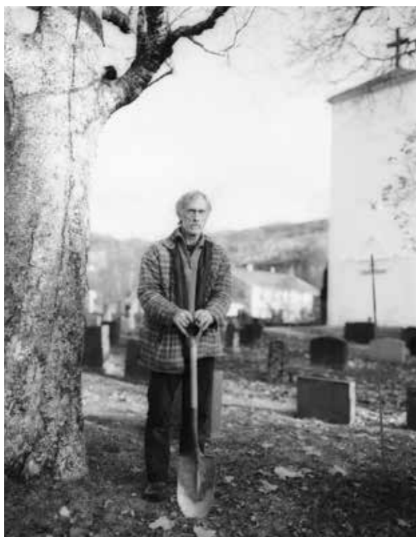
Kirketjener i Fyresdal. Vest-Telemark 2013.