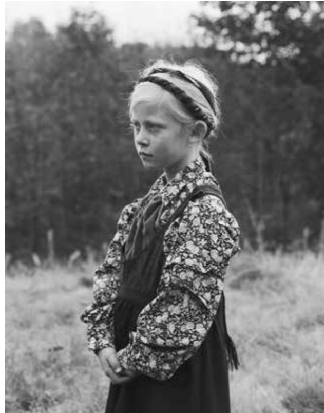
Jente i stakk på Hørte i Midt-Telemark. 2013.

assosiasjoner til de klassiske dokumentarfotografenes arbeid på slutten av 1800-tallet. Som dem, fotograferer han i sort-hvitt og bruker analogt storformatkamera, og som dem beveger han seg som en oppdagelsesreisende gjennom landskapet, — langsomt, søkende, åpen og tålmodig. Helst reiser han på sin klassiske Pashley-sykkel, med telt, sovepose, et 10-kilos Linhof Technika kamera og stativ. Slik når han ut dit han finner sine motiver i nær kontakt med naturen og menneskene han møter.