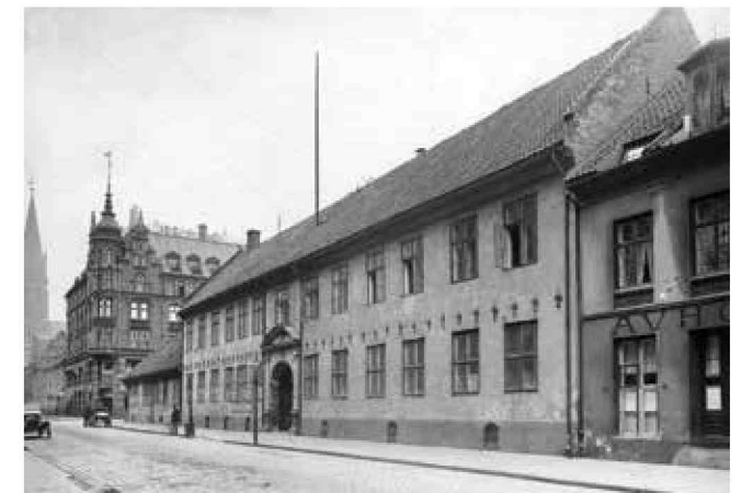
Gården i Rådhusgata 13. Visittstuen lå innenfor de to vinduene til høyre for porten.

regnet som en av byens stiligste og beste bygninger, vakkert innredet med store selskapsværelser. Da gården ble revet i 1913, ble flere av disse værelsene gitt i gave til Folkemuseet. I tillegg til visittstuen ble den tilstøtende festsalen og tre andre selskapsværelser nå flyttet til museet.