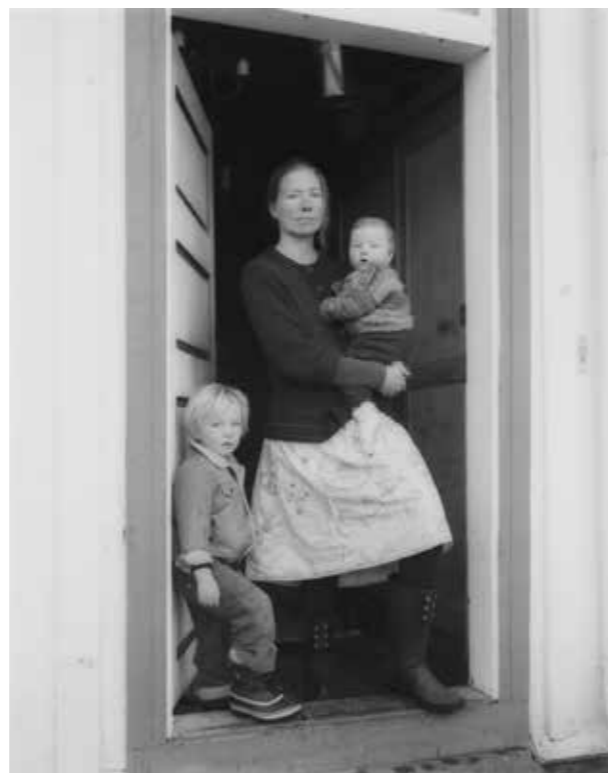
Kvinne med barn i Mo. Vest-Telemark 2013