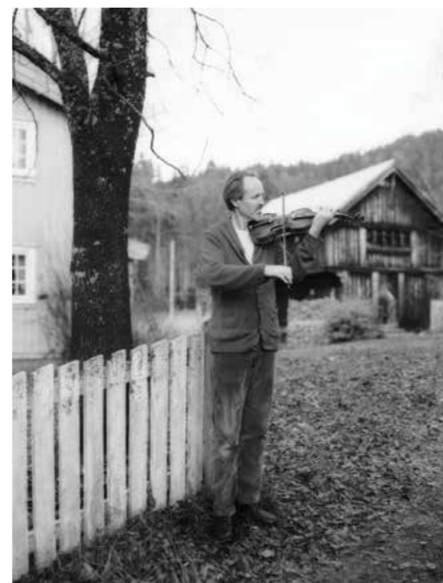
Spelemann i Åmot. Vest-Telemark 2013.