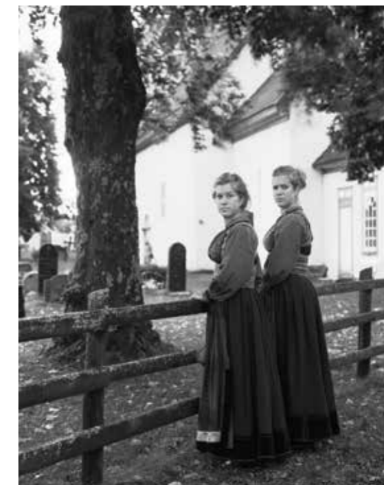
Søstre ved Nes Kirke, Gvarv. Telemark 2013.

for livet der i generasjoner. Mest av alt retter han linsen mot menneskene. Gjennom direkte og følsomme portretter, møter vi dem i deres dagligliv, — ansikt til ansikt.