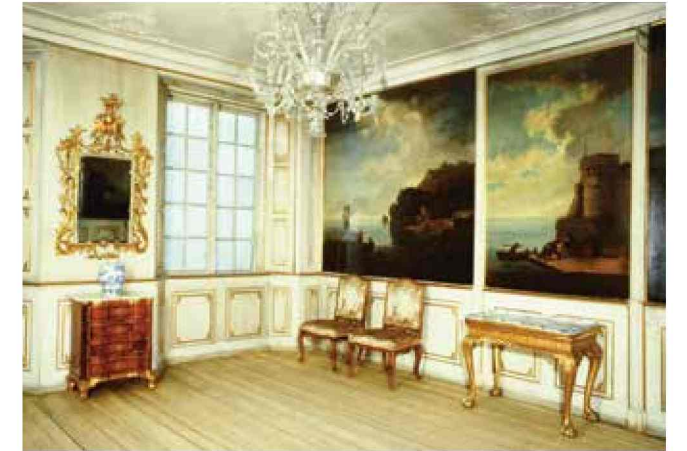
Visittstuen i sin fordums prakt slik den var utstilt i Bysamlingen.

Mathia og Morten var unge og nygifte, de ville ha alt nytt, og de var midtpunkt i et «strålende» selskapsliv i Christiania. Nybygget i Rådhusgata 13 kan ses som uttrykk for at paret ønsket et tidsmessig og representativt hus i byen. Etter tidens krav måtte huset stå i stil med en kontinental livsførsel, og rokokko var høyeste mote på den tiden det sto ferdig. Det ble da også