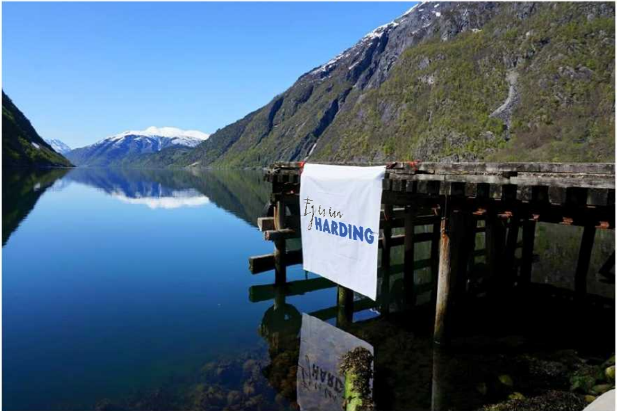
Fjorden er vegen og ferja er arenaen for HardingTokt 2017.