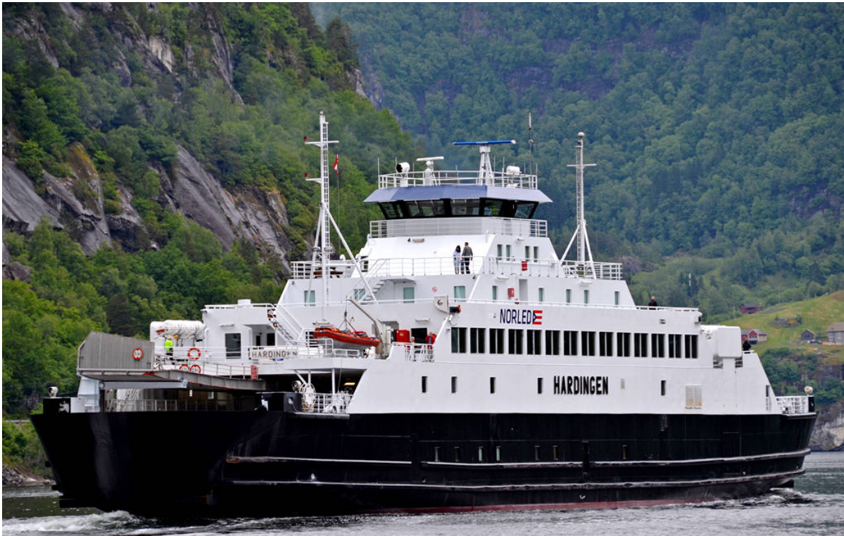
M/F Hardingen gjekk ut av trafikk i Hardanger i 2015.