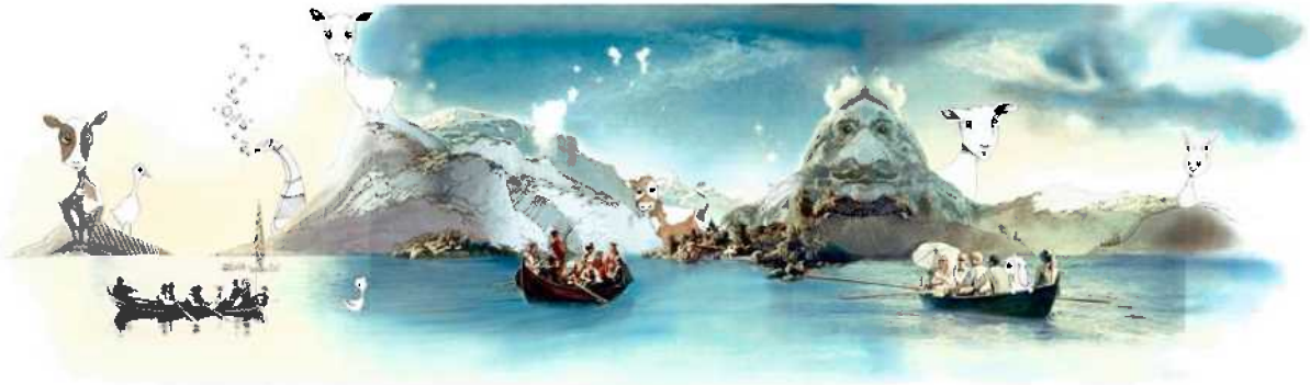
Moderne brureferd i Hardanger gjennom prosjektet HardingTokt 2017!