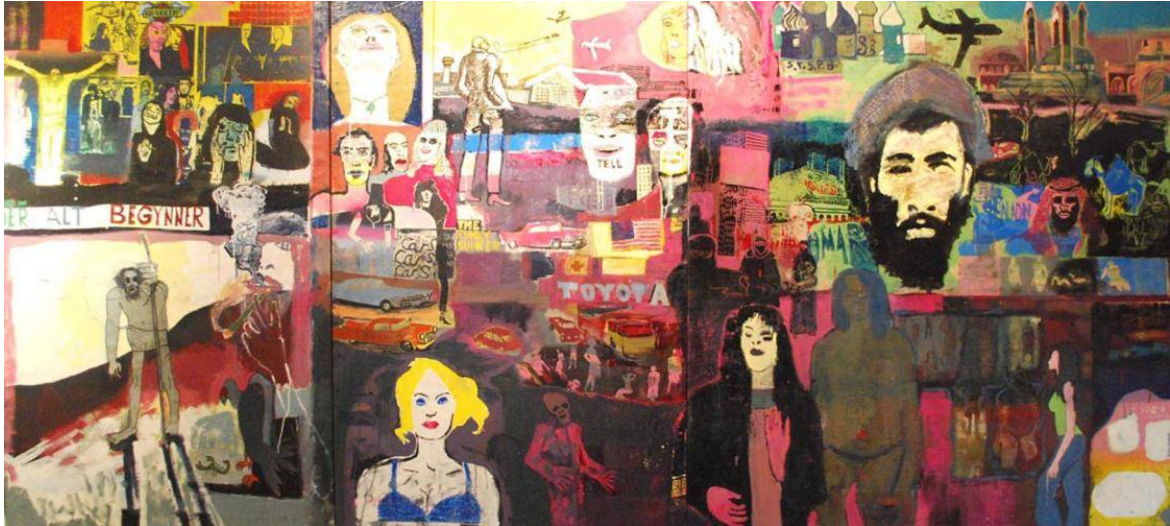
Foto: Fra Verdensbilde av Jan Henning Larsen (tresnitt på lerret)