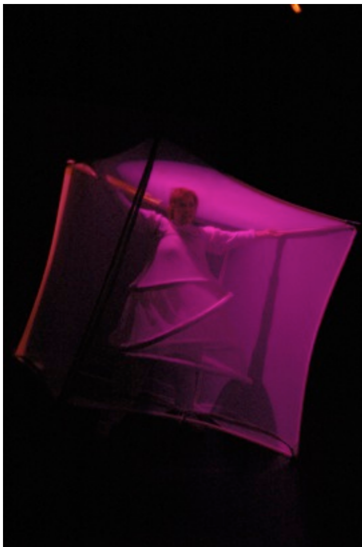
(Fra «PoY!» Barneopera -Nederlands nasjonalopera)

I denne søknaden søker Opera Omnia om et generelt tilskudd som skal brukes på flere (jubileums) forestillinger sesongen 2016-2017 samt annet aktivitet i Studio E39. Det dreier seg om forestillinger for barn, for og med ungdom, eldre og et generelt publikum. Forestillinger som vi regner med å kunne spille ulike steder i Hordaland og for mellom 1700 - 2000 mennesker over en periode på et drøyt år.