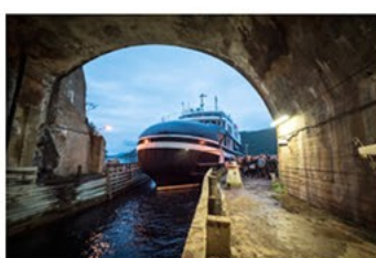
Båden med udstillingsbesøgende ankommer til Olavsværn.