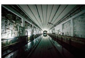
Ubådsdokken på Olavsværn, oplyst af Alexander Lysovs lysinstallation.

Udstillingen er bygget op som én stor totalinstallation spredt over de mange rum og tunnelgange. Værkerne varierer bredt, og både video-, lyd-, lys- og performancekunst er repræsenteret, ligesom poesi og russisk sang er det. Nogle værker forholder sig eksplicit til det politiske forhold mellem Rusland og Vesten, mens andre baserer sig friere på udstillingens tematikker og på stedets regulerende arkitektur.