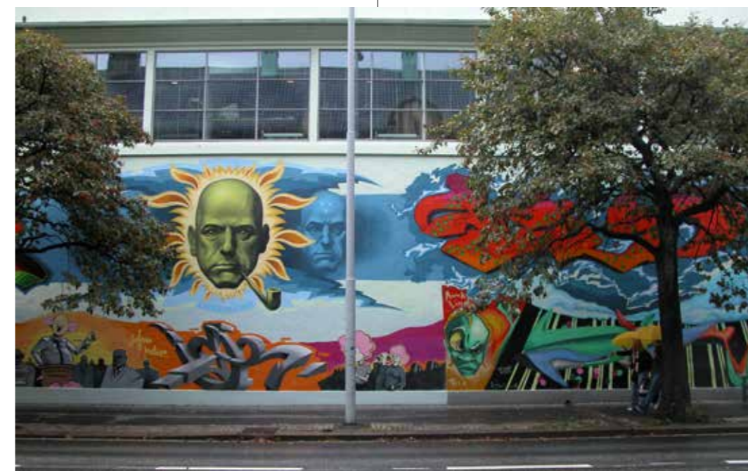
Den Femte Veggen , 2003, Bergen Kunsthall