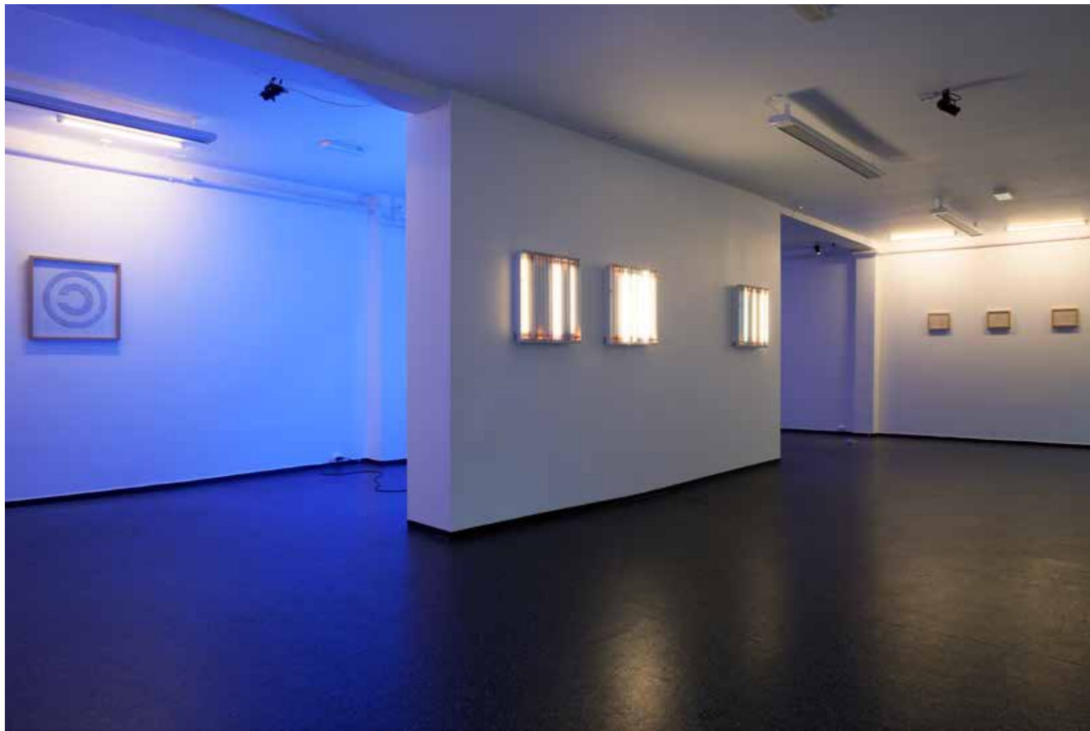
Fra utstillingen Light crossing light , 2013.