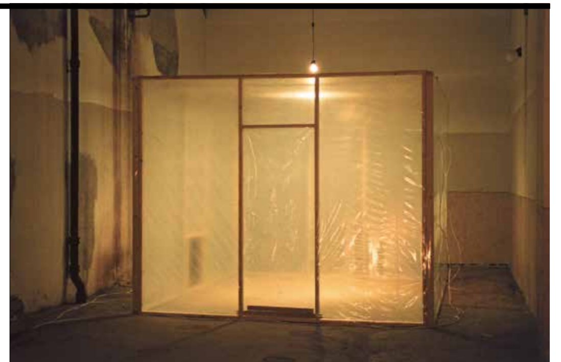
37 grader celsius, 2003, fra utstillingen Artificial life Stavanger .

«Vi inviterte kollegaer fra akademiet – studenter, men også lærere og mer etablerte kunstnere. Vi hadde en utstilling hver uke i seks uker. I retrospekt er det lett å se at dette foregikk inne i et slags vakuum der det ikke eksisterte noen ting.»