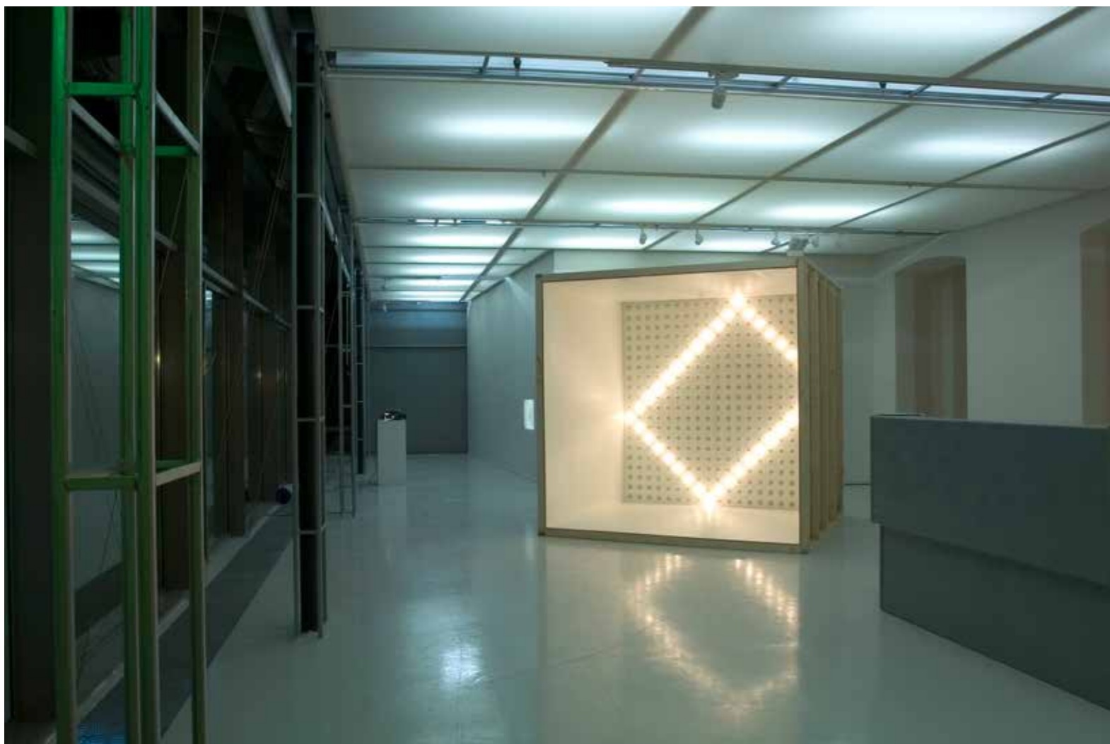
Fra utstillingen Remis , 2004.

etablerte delen av kunstscenen, for han ble hyret inn som lærer ved KHiB Avd. kunstakademiet. Kort tid etter befant han seg i posisjonen som koordinator for masterstudiet i kunst på samme høyskole. Men hva er det som får en kunstner-kurator til å klatre fra solide posisjoner i det institusjonelle etablissementet «ned» til det uavhengige feltet?