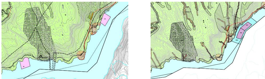
Figur 1 a og b: Endringsforslag i ny kommunedelplan. Akvakulturlokalitet ved Blom er fjerna, medan Skaftå er utvida.

Fylkeskommunen vektlegg behovet for forutsigbarheit i vurderinga av området ved Blom. Det har vore anlegg på lokaliteten i over 20 år, og akvakulturområde i arealplanen sidan 2003. Fylkesrådmannen rår til at det vert fremja motsegn til dette punktet.