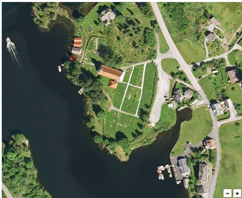
Figur 3. Hosanger kyrkjestad