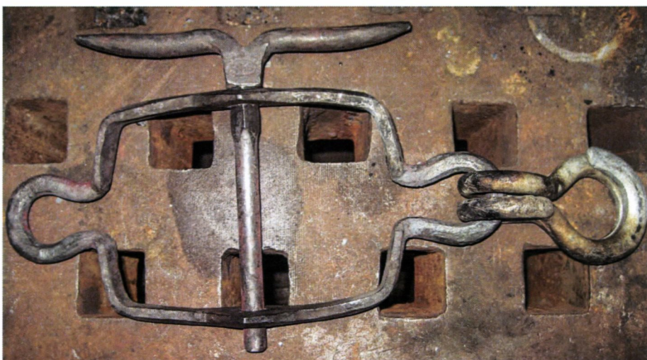
Smidde, fremfor sveiste beslag gjør en forskjell. Her et utvendig blokkbeslag. HFS.

Støpte og smidde deler skal støpes og smis, dersom deler skal kopieres. Det er ikke akseptabelt å sveise opp kopier av støpte og smidde deler. For å bevare gamle deler kan sveising være en aktuell reparasjonsmetode.