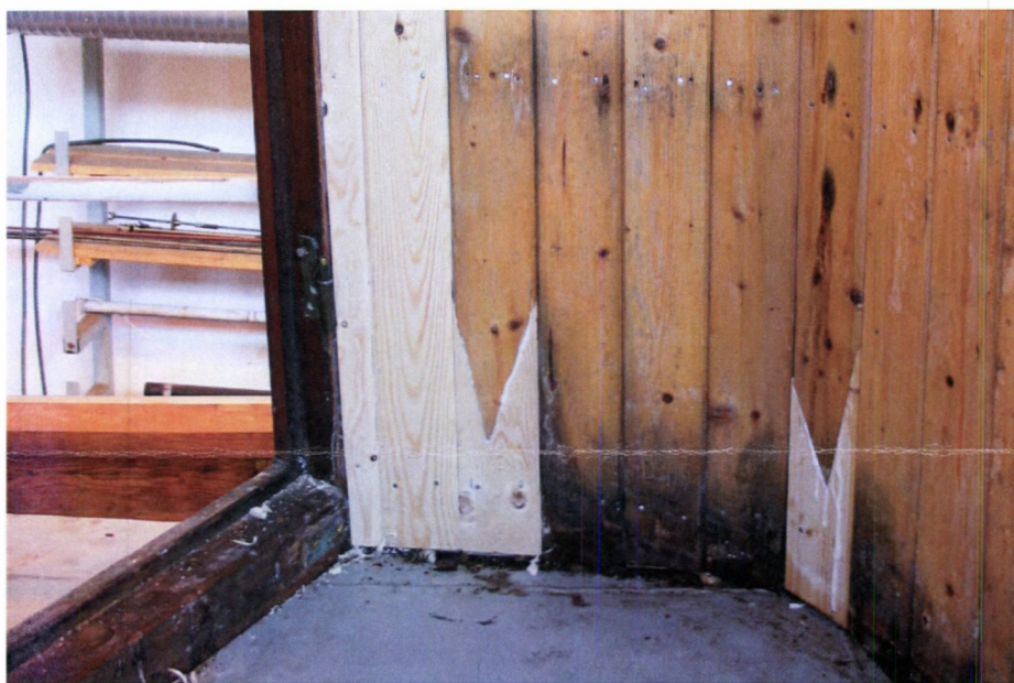
Et forsøk på å bevare mest mulig av de opprinnelige panelene i styrhuset på «RS Bishop Hvoslef». Råteskadde deler er byttet ut med frisk materiale av tilsvarende kvalitet. NNFA.

Jo mer av dokumentasjonen som er på plass før et prisoverslag blir utarbeidet, jo mer treffsikkert blir overslaget. Her har alle parter en felles interesse i å få størst mulig forutsigbarhet. Etter at demonteringsprosessen har kommet i gang bør en derfor lage et overslag ut fra det omfanget som da viser seg. Demontering bør altså også ha som mål å avdekke fartøyets tilstand i størst mulig grad.