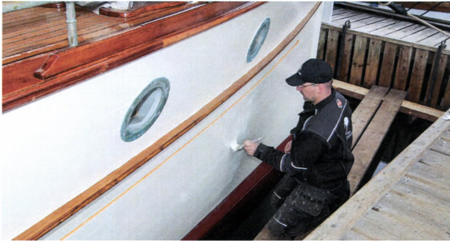
«Faun» males med linoljemaling slik det var opprinnelig. HFS.

Handverkeren som utfører arbeid på fartøyet, vil av og til se løsninger som kanskje ikke har vært kjent. I så fall vil det være viktig å dokumentere slike løsninger og la disse være styrende for restaureringsarbeidet. Viser dokumentasjonen at det har vært brukt bestemte løsninger er det disse som skal brukes, selv om de kanskje virker fremmede eller ikke er teknisk optimale.