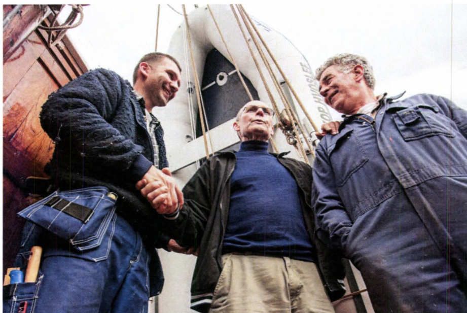
God kommunikasjon mellom verft og eier er en forutsetning for ei god restaurering. Eier må gjøre all historisk dokumentasjon tilgjengelig for verftet, samt være delaktig i beslutninger og føre dialog med Riksantikvaren. A. T. Sæther. NNFA